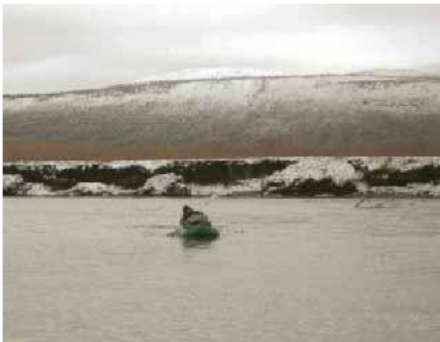
Уход от нависших над рекой обрывов.

Вообще, замерзание рек – процесс длительный и сложный. Ледостав происходит в течение нескольких дней, причём раньше всего замерзают озёра, потом тихие, спокойные долинные реки, а уж затем – быстрые реки горных долин.