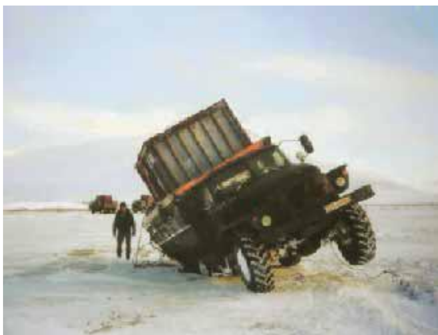
Автомобиль в наледи.

Наледь зимой – один из самых страшных врагов человека на белой тропе. На первый взгляд её существование противоречит законам природы. Откуда ни возьмись на сорокаградусном морозе вдруг из-под снега начинает течь живая вода. Причём порой эта картина настолько живописна, что просто потрясает воображение даже многие испытавших людей.