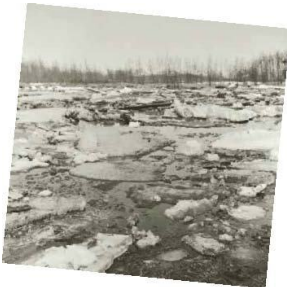
Ледоход на реке Убиенке.

Дождевые паводки неприятны своей непредсказуемостью. Конечно, если беспрестанно с неба сыплется мелкий нудный дождичек, который усиливается день ото дня, при этом грунт постепенно напитывается водой, то не надо быть колдуном, чтобы предположить, что вода в реке в конце концов поднимется. Но бывает и так – в далёких верховьях реки проходят мгновенные проливные дожди, поднимающие уровень воды в сотнях километрах вниз по течению буквально за считанные часы.