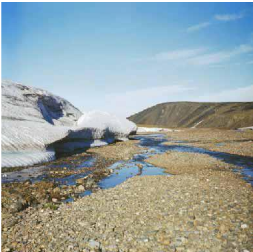
Панцирь нетающего льда (Амгуэмская наледь).

Кроме зимних наледей бывают ещё и летние. Точнее – это те же зимние наледи, но не успевшие растаять к середине лета. Иногда они не тают полностью до следующей зимы – тогда они становятся наледями многолетними. Многолетние наледи особенно распространены в Якутии, где носят гордое название тарьынов . Самая большая многолетняя наледь, длиной более сорока километров, лежит на притоке Индигирки реке Моме и звучно зовётся Улахан Тарын, что попросту значит – Большая Наледь. Такие наледи имеют значение, прежде всего, для тех, кто передвигается сплавом по этим рекам. Дело в том, что в первую половину лета эти наледи зачастую являются непроходимыми. Вода прорезает в них множество мелких тоннелей, которые сверху прикрыты бело-голубым панцирем. Обычно они имеют форму овала, вытянутого вдоль русла реки, длиной в один-два километра, так что не составляет труда обнести весь груз и сами лодки по краю этой ледяной линзы.