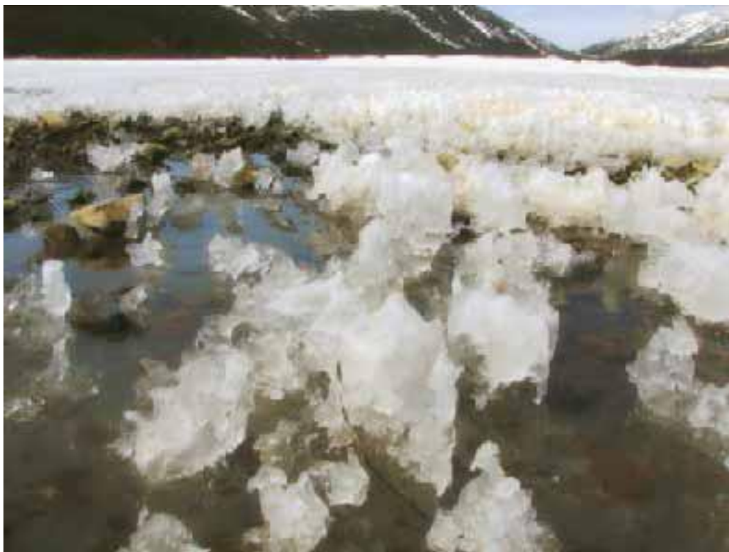
Тающий лёд: причудливые, практически воздушные формы.

Первым начинает раскисать снег на южных склонах холмов, сопок, берегов рек, а также на пространствах, по которым зимой ветер нёс пыль от каких-нибудь дюн или песчаных кос. Но раскисает он постепенно – ночью стоит устойчивый минус, и эти перепады температур способствуют образованию ледяной корки – наста. Наст иногда выдерживает даже человека без лыж, а уж лыжника-то он удержит всегда. Период настообразования чётко подсказывает путнику, что пора валить к ближайшему жилью – на реализацию этой идеи остаются считанные дни, может быть, один-два.