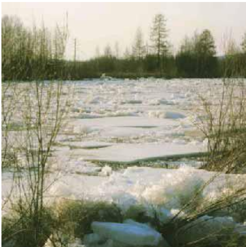
Ледоход на таёжной реке.

Мощь ледохода из всех стихий сопоставима только с энергией снежной лавины. Но завывка в том, что далеко не каждый опытный путешественник хоть раз в жизни встречался со снежной лавиной. А вот ледоход происходит на каждой реке каждый год. Ледоход уносит с берегов десятки квадратных километров леса, срывает с неудачных стоянок баржи и катера, сносит поставленные избышки, перелопачивает тысячи кубических километров грунта. Но ледоход создаёт и ещё одну проблему, которая может в одночасье превратить его из титанического явления природы в катастрофу, подобную азиатскому селю.