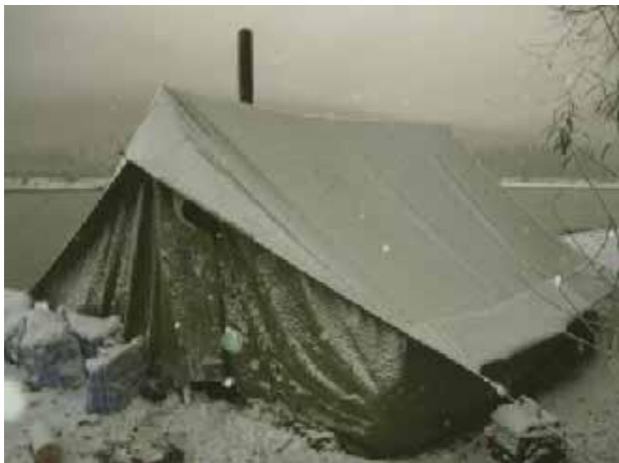
Лагерь в пургу.

Помните, что в самом начале я писал о синдроме ожидания пурги у путешественников? Он проходит после того, как вы повстречаете её лицом к лицу. Но такая встреча закончится для вас благополучно, только если вы в своей жизни руководствуетесь принципом «Никогда не сдавайся!».