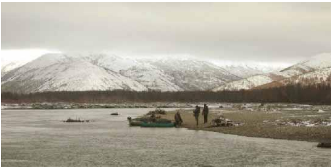
Поиски места для лагеря.

Первый снег в России характерен тем, что рано или поздно, но он всё равно пойдёт. Поэтому где-то с середины сентября к снегу надо быть готовым в любой момент. Если вы находитесь на зимовье, то помните – у снега существует противное свойство засыпать все предметы. Причём далеко не все они после его таяния могут обнаружиться весной. Особенно это относится к топорам. Кроме того, ежели снегом что-нибудь замело, то найти это «что-то» прямо сейчас становится очень и очень проблематично. Поэтому в ожидании выпадения снега желательно всё снаряжение или прятать под крышу, или закрывать тентами или ящиками.