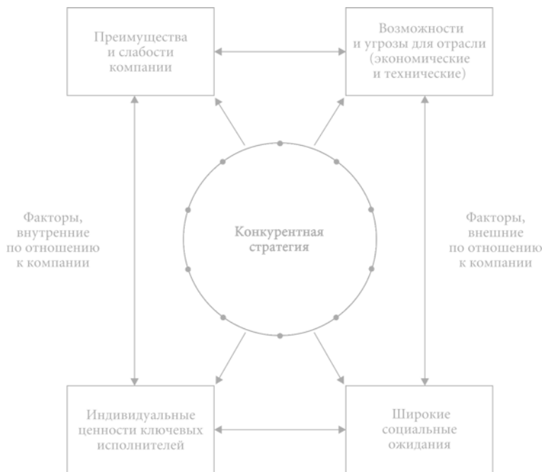
Рис. 2. Контекст формулирования конкурентной стратегии

бости в сочетании с индивидуальными ценностями определяют внутренние (по отношению к компании) ограничения, накладываемые на возможности выбора успешно реализуемой стратегии.