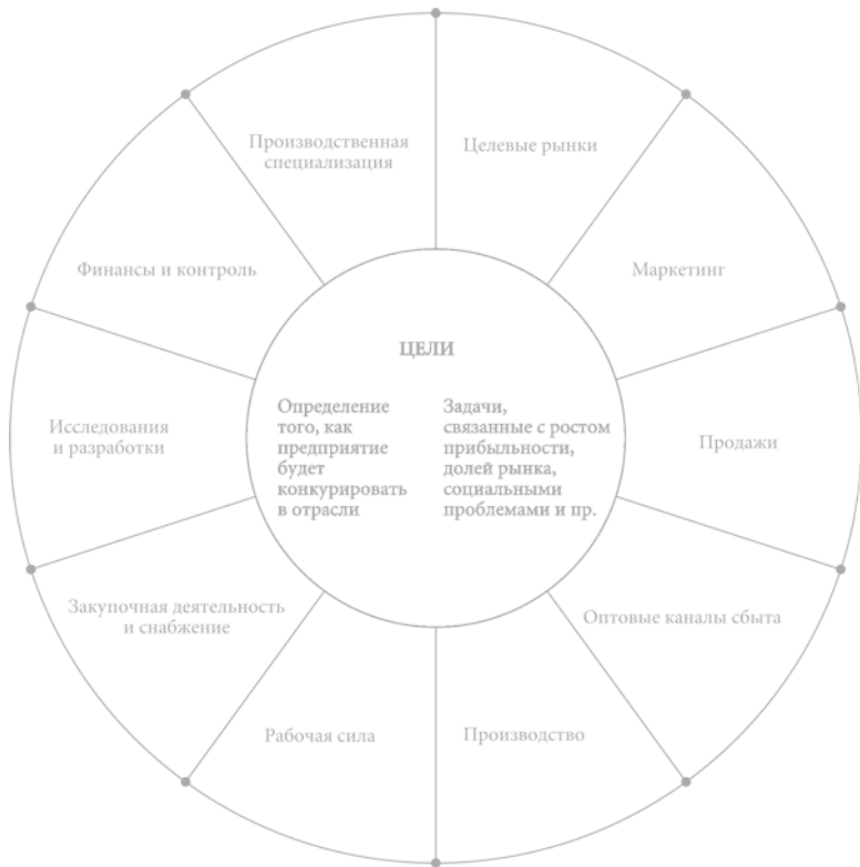
Рис. 1. Колесо конкурентной стратегии

Рисунок 1, который может быть назван «Колесом конкурентной стратегии», служит в качестве средства наиболее сжатого отображения ключевых аспектов конкурентной стратегии фирмы. Осью колеса являются цели фир-