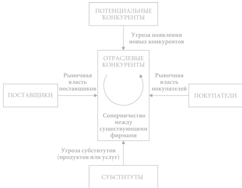
Рис. 1.1. Силы, определяющие отраслевую конкуренцию

Эта глава посвящена определению ключевых структурных характеристик отраслей, от которых зависит интенсивность воздействия конкурентных сил и, следовательно, отраслевая прибыльность. Задача конкурентной стратегии любой бизнес-единицы состоит в том, чтобы найти такую позицию в отрасли, которая позволит ей наилучшим образом защитить себя от этих конкурентных сил или воздействовать на них с выгодой для себя. Поскольку совокупное влияние