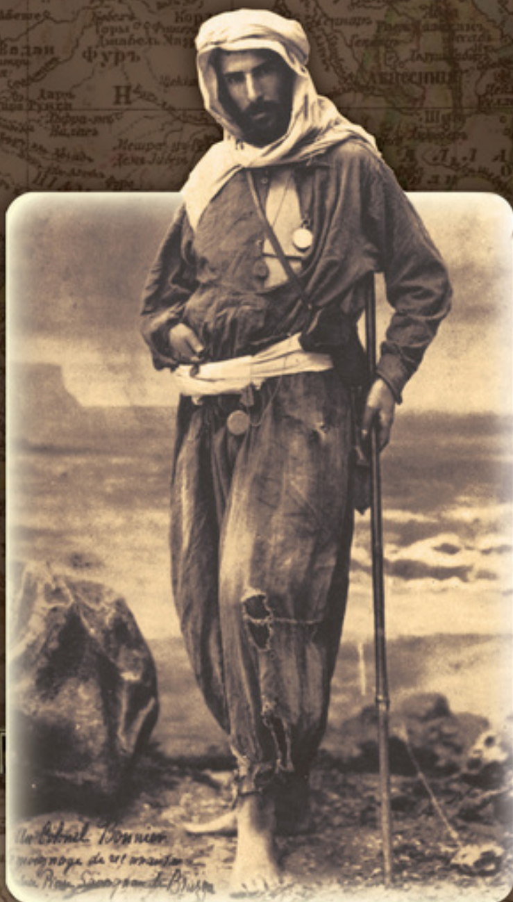
De Brazza, Pierre Savoirnian de Brazza Pierre Savoirnian de Brazza