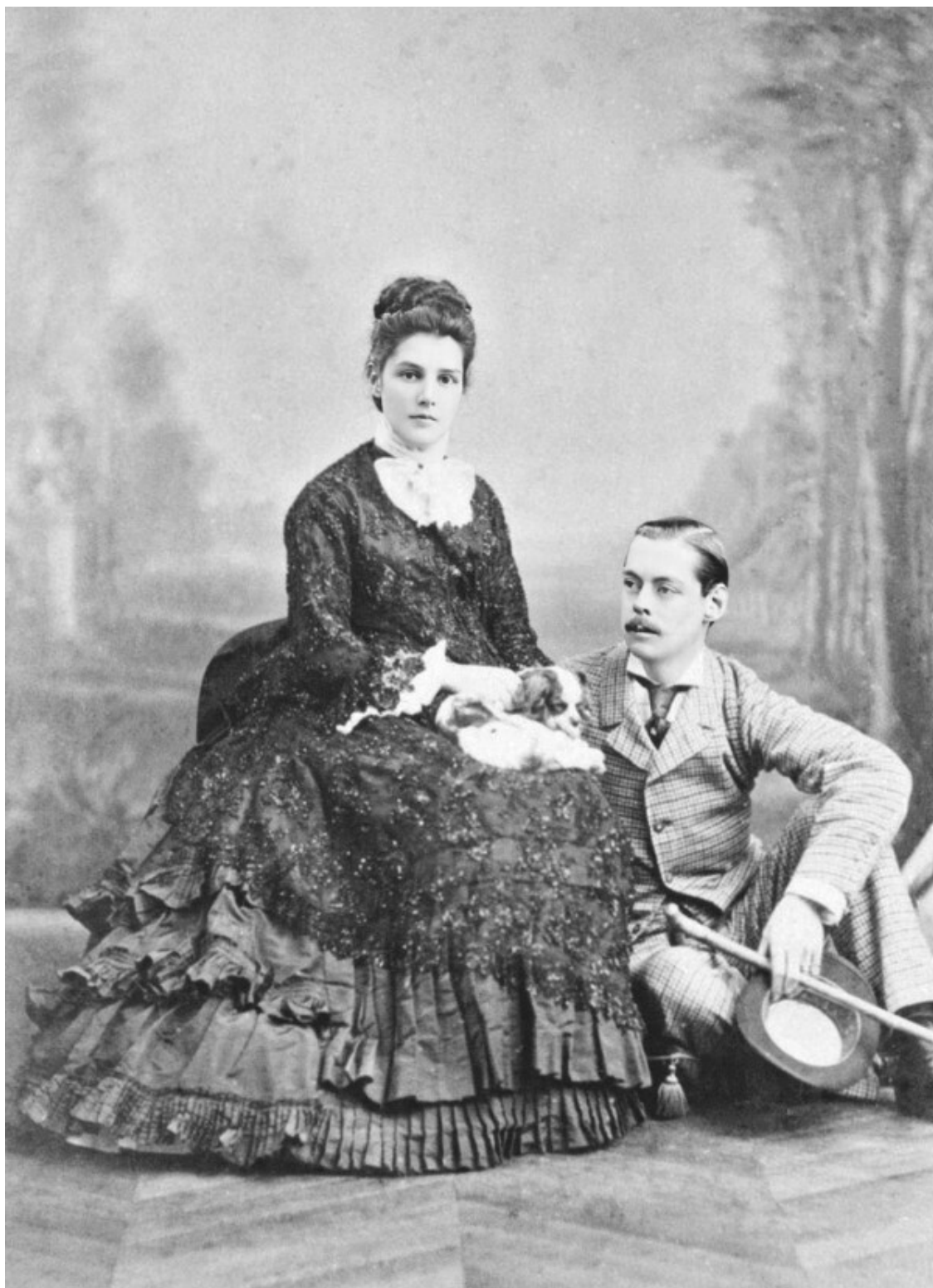
Лорд Рэндольф Черчилль и леди Джейн Джером. 1874