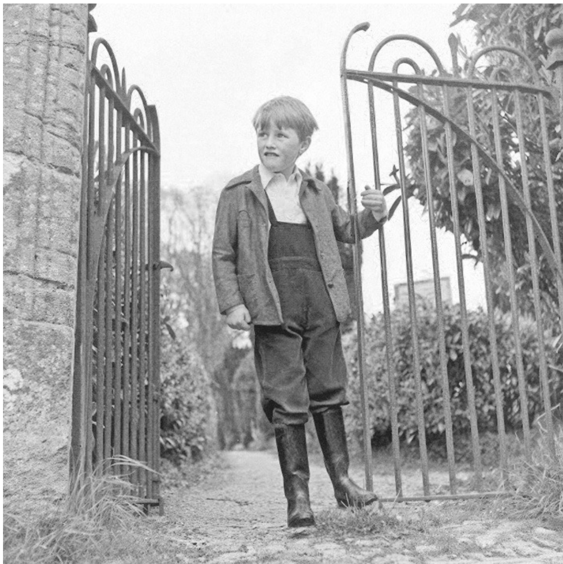
Уинстон Черчилль в детстве