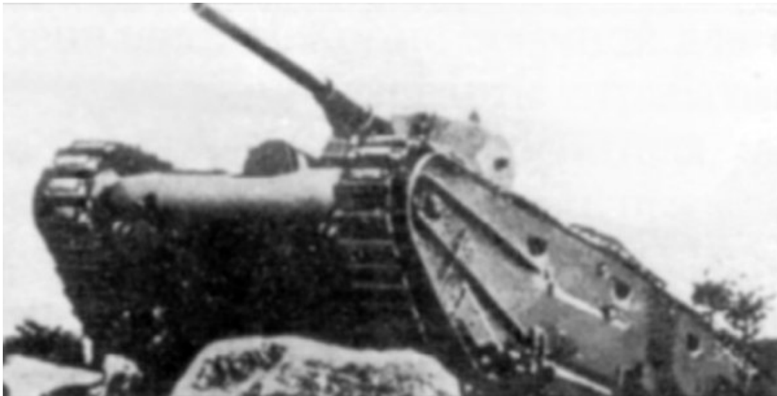
«Большие трактора». Масса 15–19,3 т, экипаж 6 человек, вооружение – 75-мм орудие и 3–4 пулемёта. – Усов М. Военно-техническое сотрудничество с иностранными государствами // Техника и вооружение. 2004. № 7. С.6.