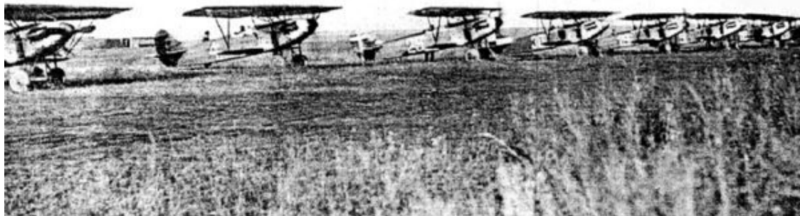
Истребители «Фоккер Д-ХІІІ» на лётном поле липецкой авиашколы

и все транспортные расходы, в том числе и перевозку по советской территории от Ленинградского порта до Липецка 32 .