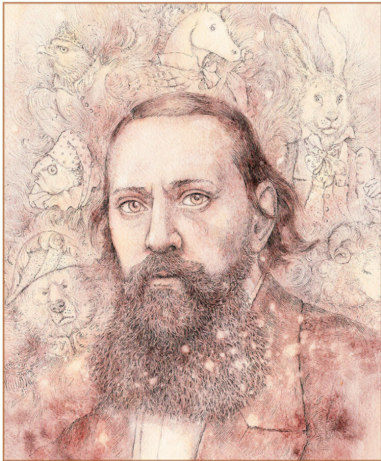
Михаил Евграфович Салтыков-Щедрин (1826–1889)