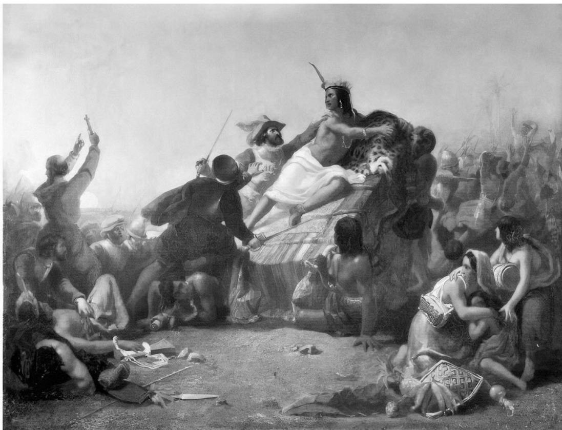
Д.Э. Милле. Писарро берет в плен правителя перуанских инков. 1845

владычества, и это восстание было не единственным, но испанцам удалось сохранить контроль над Перу – местные жители не могли победить в противоборстве с великой державой.