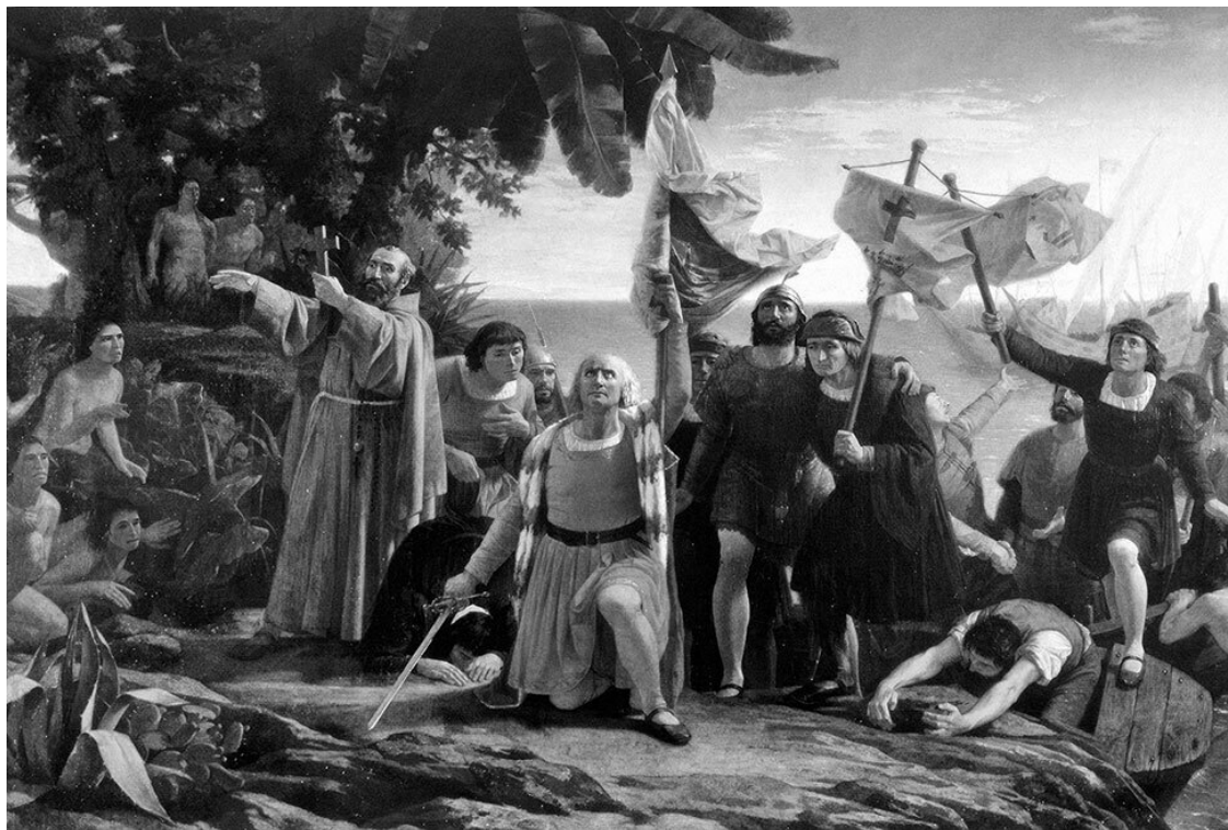
Пуэбла Диоскоро. Высадка Колумба в Америке. 1862

– тот самый, от имени которого произошло название «Америка». Тем не менее Колумбу удалось сохранить монопольное право на открытие новых земель на западе, и 30 мая 1498 года он отбыл в свою третью экспедицию (на трех кораблях), в ходе которой достиг большого острова, названного им Тринидад, и проплыл вдоль южного побережья полуострова Пария 6 , совершив там две высадки. Сначала Колумб принял полуостров за остров и назвал его Землей Грасия, но когда зашел в тупик в поисках западной оконечности «острова», изменил название на «Пария». 7