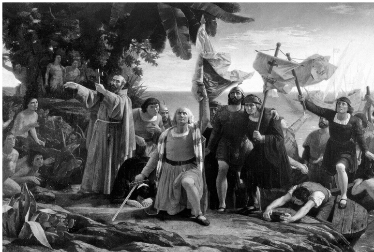
Пуэбла Диоскоро. Высадка Колумба в Америке. 1862

Сначала Колумб принял полуостров за остров и назвал его Землей Грасия, но когда зашел в тупик в поисках западной оконечности «острова», изменил название на «Пария». 7