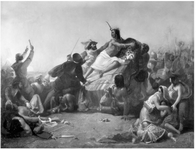
Д.Э. Милле. Писарро берет в плен правителя перуанских инков. 1845

Прежде, чем перейти к рассказу о колонизации северо-восточной части Южной Америки, нужно упомянуть о выкупе, заплаченном конкистадорам императором Атауальпой, которому марионеточный правитель Манко Инка Юпанки приходился братом. Коварно захваченный испанцами Атауальпа предложил в обмен за свою свободу заполнить до потолка золотом помещение, в котором его держали закованным. Услышав столь щедрое предложение, Писарро пришел