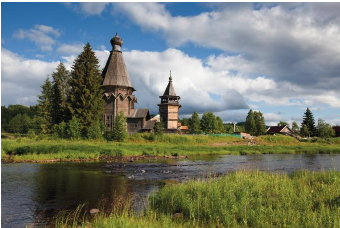
Церковь Николая Чудотворца до реставрации, XVII век

Храм в свое время несколько раз перестраивался, но к нам дошел именно в таком виде: изящный шатровый восьмерик – типичная обонежская конструкция церквей того времени.