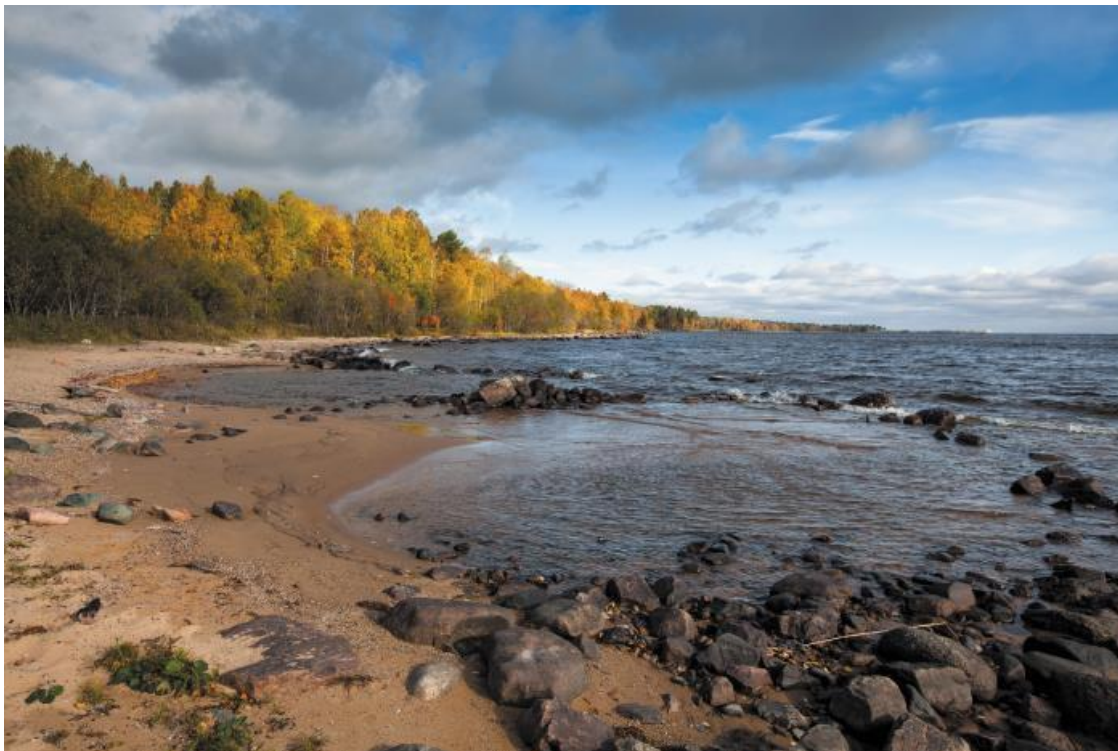
Осенний день на Онежском озере

ства земли Русской, что не уместятся ни в какой, даже самой большой шкатулке в мире. Драгоценными камнями блестят на онежских берегах храмы и часовни, лемех куполов и ажурные узоры причелин. Венчают онежское ожерелье шедевров безымянных народных зодчих, бесспорно, Кижь.