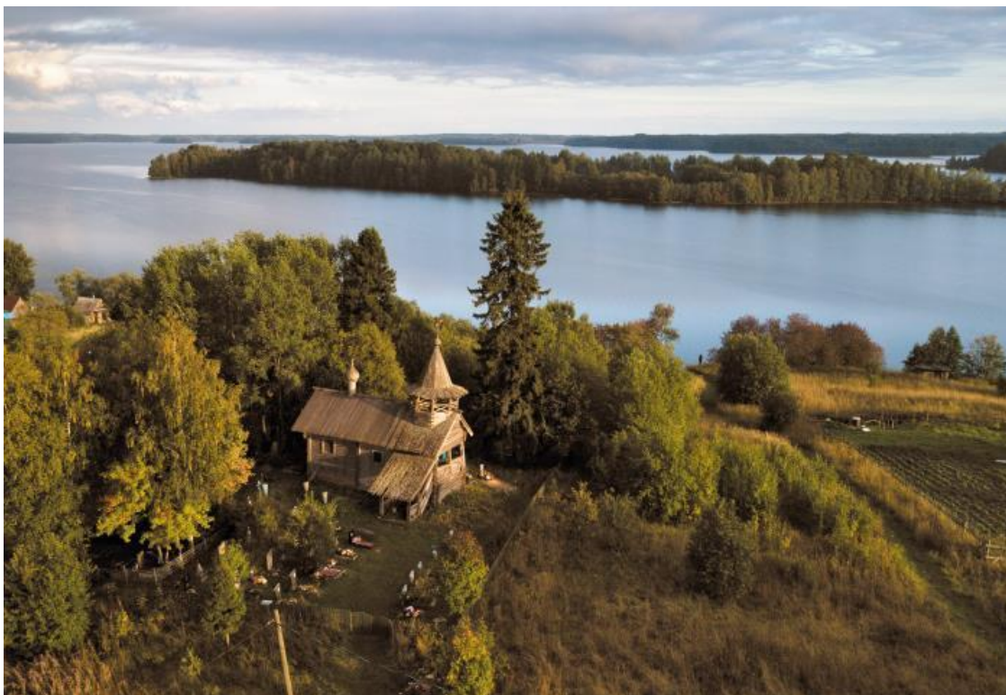
Часовня Петра и Павла, вторая половина XVIII века

Во время войны, до 1944 года, деревня была оккупирована финнами. Они считали ее своей, поэтому ничего не ломали, местных не обижали, ушли по дороге, которую сами же и построили.