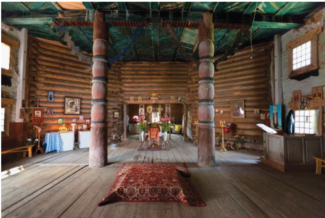
Интерьер церкви Николая Чудотворца до реставрации