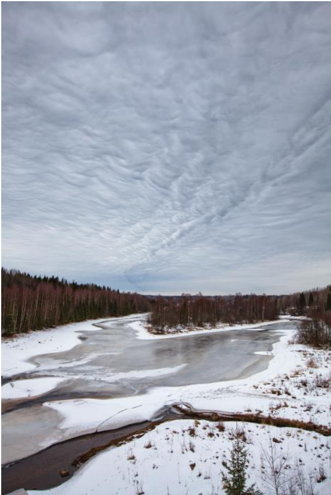
Река Важинка весной

Храм в свое время несколько раз перестраивался, но к нам дошел именно в таком виде: изящный шатровый восьмерик – типичная обонежская конструкция церквей того времени. Именно шатровыми храмами славится весь Русский Север. Рядом с основным шатром стоит