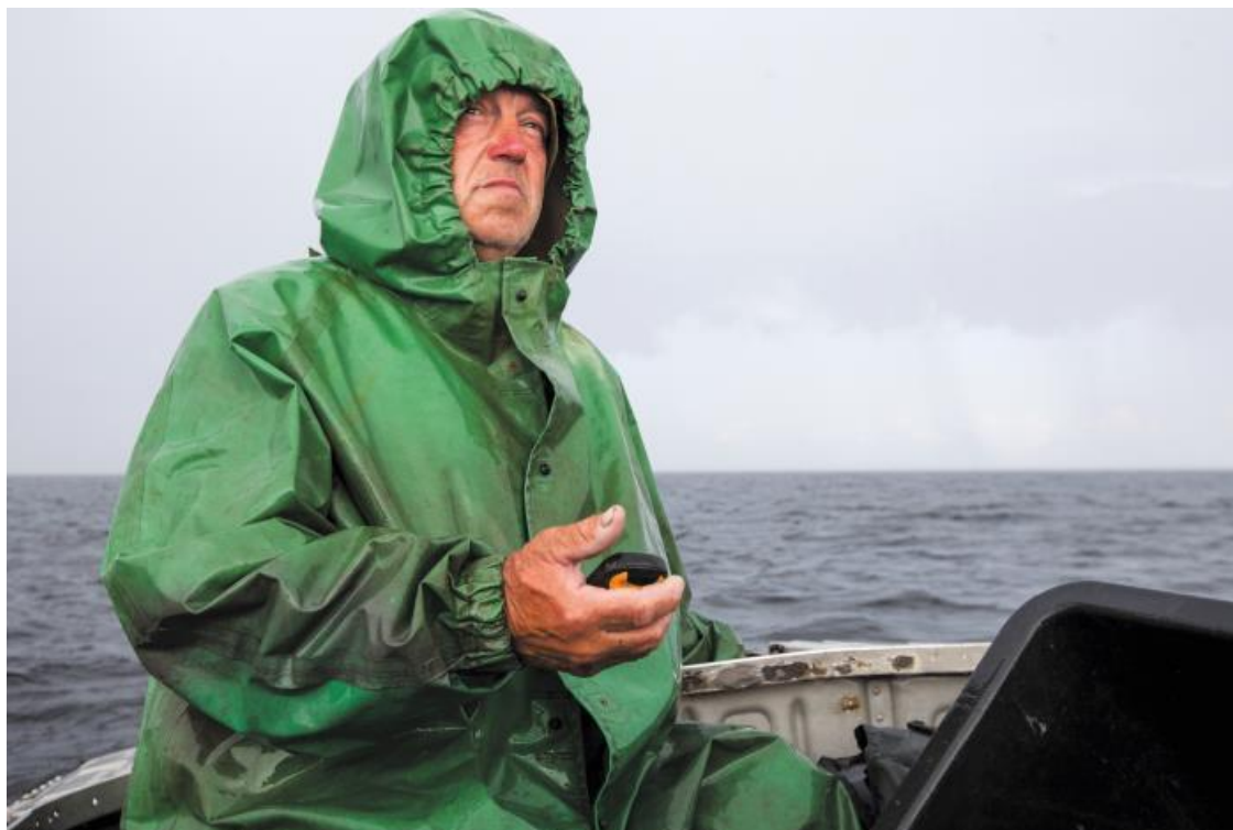
Сан Саныч на промысле