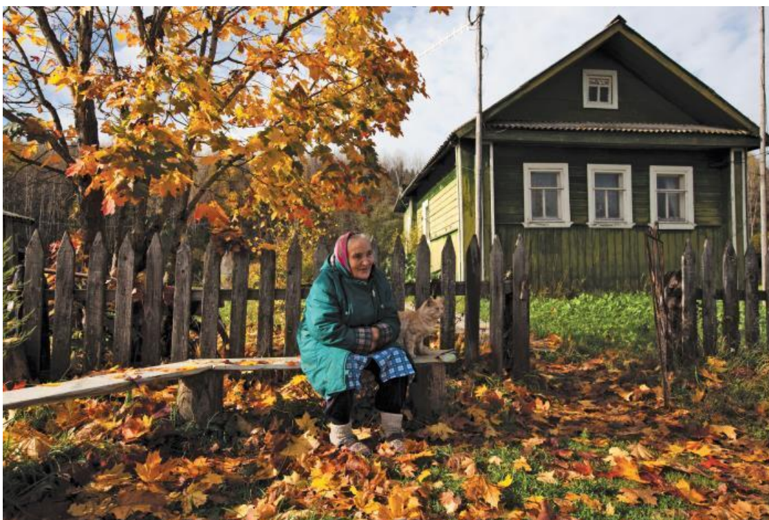
Отшумела осень жизни

Иногда бывает так, что люди хотят, чтобы их сфотографировали. Надо сказать честно, это бывает редко, а точнее, почти никогда. Хотя вот это как раз такой случай.