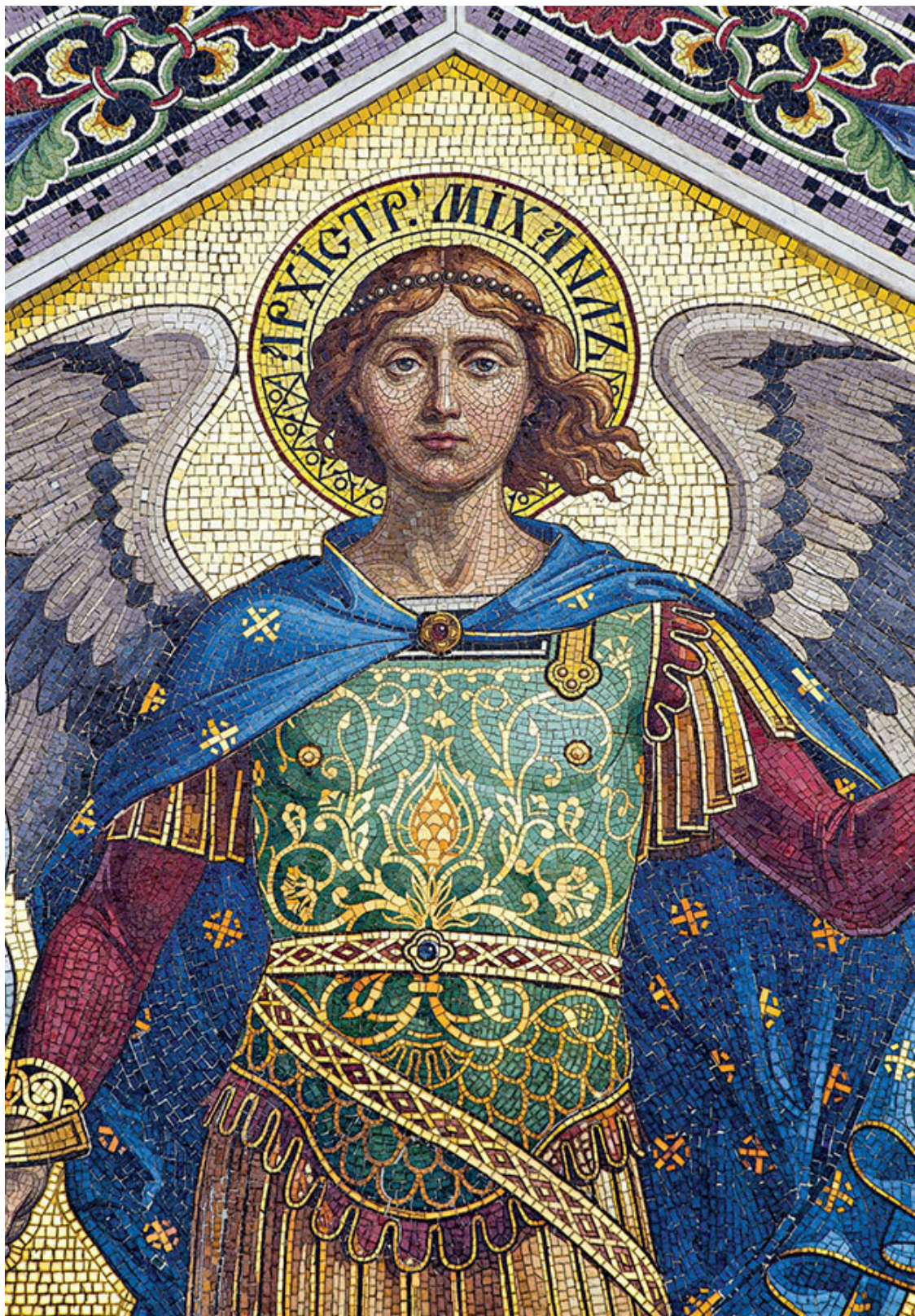
Мозаика с изображением святого архангела Михаила. XIX в. Сербия, Триест, православная церковь Святого Спиридона

«Ангелы в совокупности называются небесами, потому что они собой составляют их...»