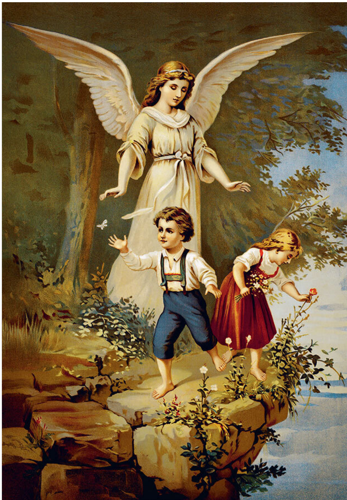
Ангел-хранитель. Открытка Викторианской эпохи

Здесь мы достигаем третьего уровня, богословского, а точнее, специфически христианского. Тейяр постулирует источник личной любви, находящийся вне эволюционного процесса, как трансцендентный абсолют, способный активировать любящую энергию мира и, таким образом, привести Вселенную к ее завершению. Он отождествляет Омегу эволюции с Христом,