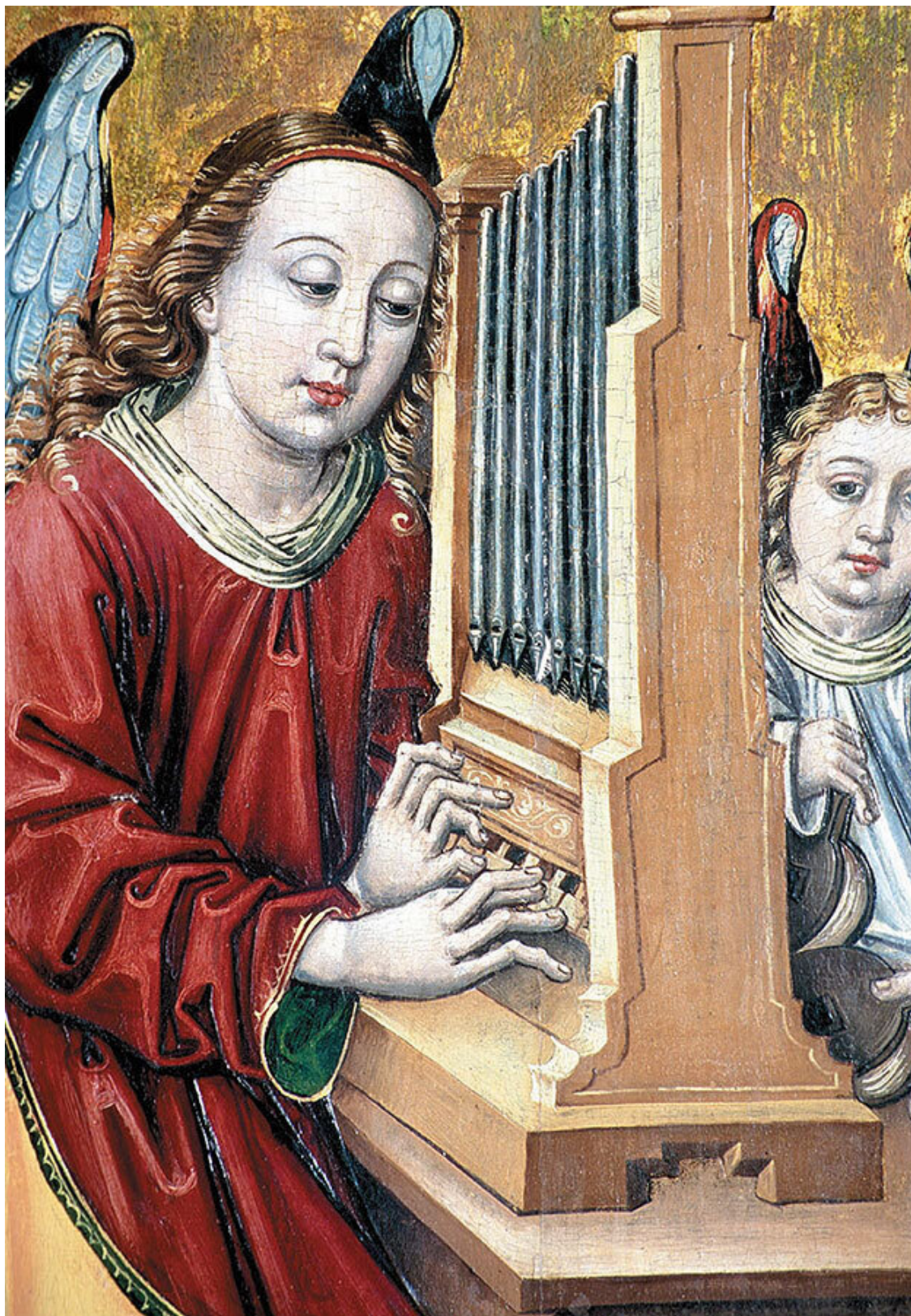
Мастера Чегёльда. Музыцирующий ангел. XV в. Венгрия, Эстергом, Музей христианского искусства

Никто и не помышлял об экзистенциальном разрыве, пока научные открытия и утопии XX века не развеяли веру в непрерывный и необратимый прогресс. Стало очевидно, что наука сама по себе не способна не только осчастливить человека, но даже дать ему самое насущное