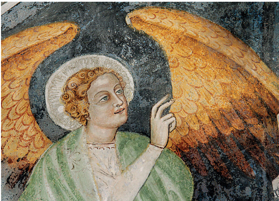
Архангел Гавриил [деталь фрески]. Италия, Больцано, аббатство Новачелла

Еще ранее Квинт Септимий Флоренс Тертуллиан, христианский апологет II–III веков, говорил, что душа, переступившая порог смерти, «ликует или трепещет, в зависимости от того, какое уготовано ей пристанище, о котором она сразу же узнает по самому лику ангела, вызывателя душ, Меркурия поэтов» 5 .