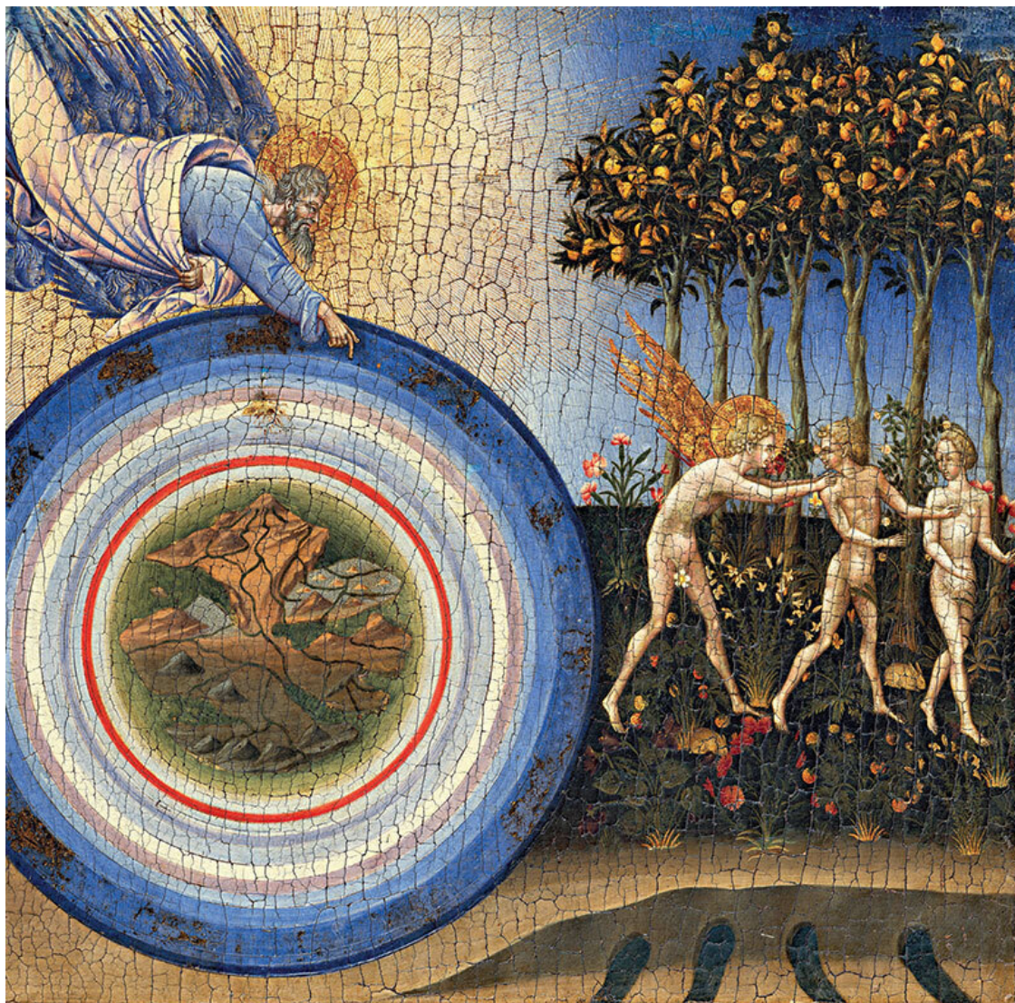
Джованни ди Паоло. Сотворение мира и Изгнание из рая [деталь]. 1445. США, Нью-Йорк, Метрополитен-музей

Сведенборг также стал предтечей теории магнетизма 7 и отцом минералогии. Эта широта интересов принесла ему славу северного Леонардо да Винчи 8 .