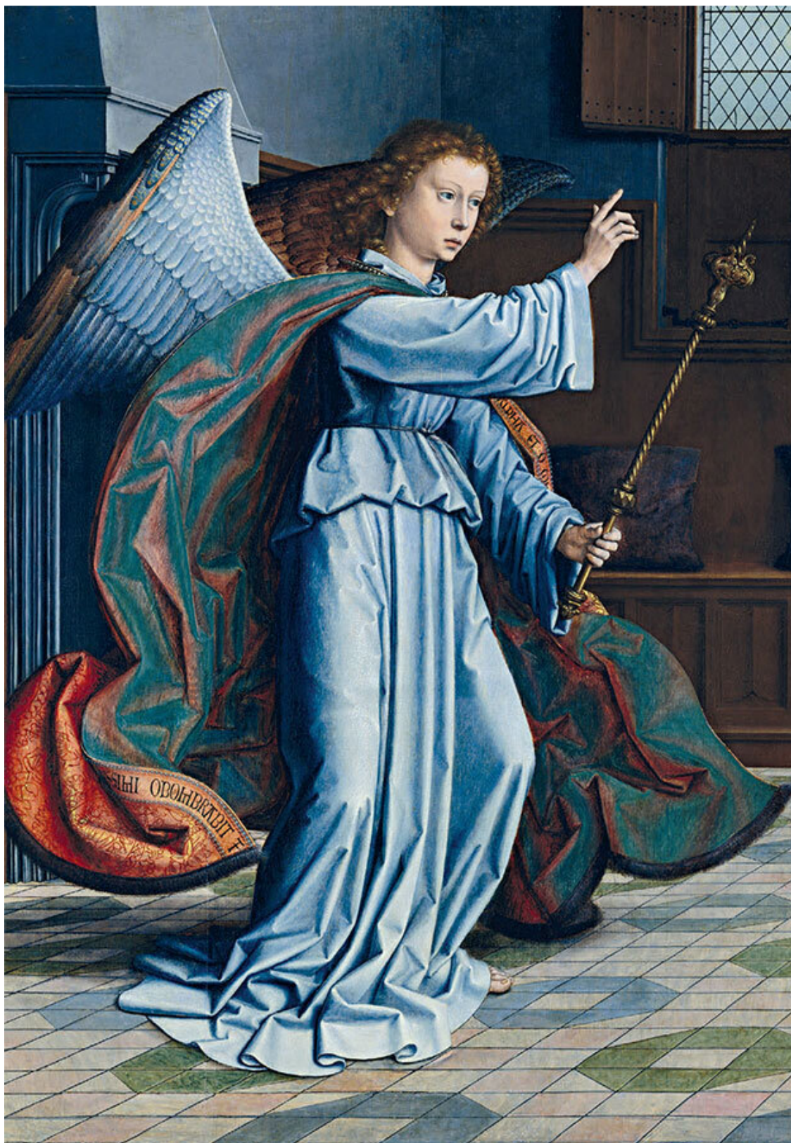
Герард Давид. Благовещение [деталь]. 1506. США, Нью-Йорк, Метрополитен-музей