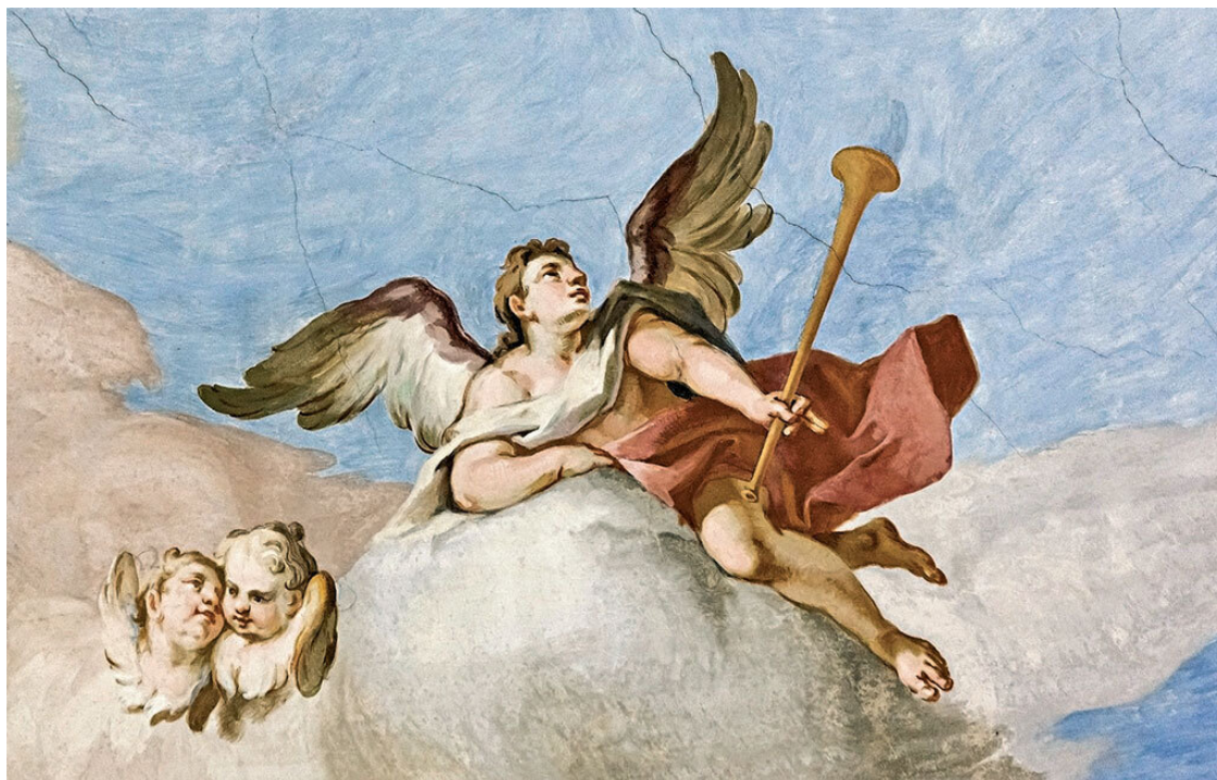
Братья Доминик и Иоганн Баптист Циммерманы. Деталь фрески потолка. 1754. Германия, паломническая церковь в Висе