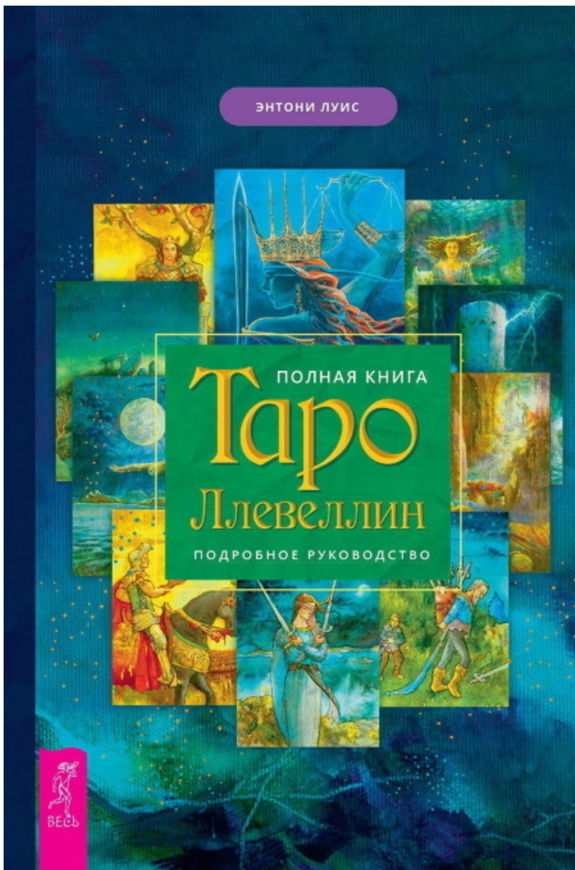
Anthony Louis Llewellyn's Complete Book of Tarot: A Comprehensive Guide