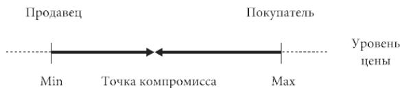
Рис. 1.1. Исходная модель рыночного торга

ставив партнёра пойти на уступки, не отказываясь от обмена. Существуют также границы континуума, за которые участники заключаемого контракта отступать не готовы, своего рода край: за его пределами обмен перестаёт быть выгодным по представлению одной из сторон, и она готова от него отказаться. Таким образом, в первом приближении торг выглядит как лобовое столкновение сторон, преследующих сходный интерес и борющихся до тех пор, пока одна из них (доминируемая) не достигнет последней черты, за которую она уже не готова более отступать, а другая (доминирующая) не исчерпает свою способность к давлению (см. рис. 1.1).