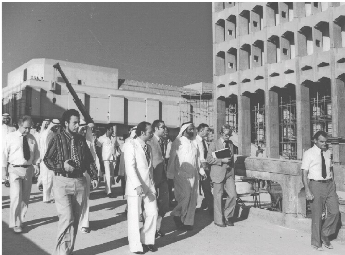
Рис. П. 4

Эксперты и советники сопровождают шейха Рашида бин Саида аль-Мактума ( на фото в центре ) во время визита на стройплощадку Всемирного торгового центра в Дубае. Около 1978 г.