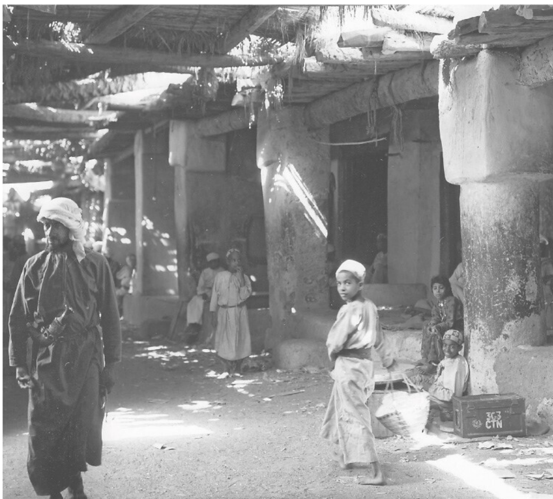
Рис. П. 2

Хозяева дубайского порта – арабские, южноазиатские и иранские торговцы – жили своей жизнью. Они пользовались некомпетентностью британских наблюдателей, поддерживая миф о порте, как реликте XIX в. На самом же деле торговцы Дубая мыслили вполне современно и тайно поддерживали обширные внешние связи. К неудовольствию англичан, город постепенно становился региональным центром торговли оружием и другими товарами. В город прибывала современная техника, а также новости и прочие веяния со всего мира. Коммерсанты слышали о политических переменах, происходивших поблизости, и о том, как за пределами Дубая приходит конец эпохе колониализма.