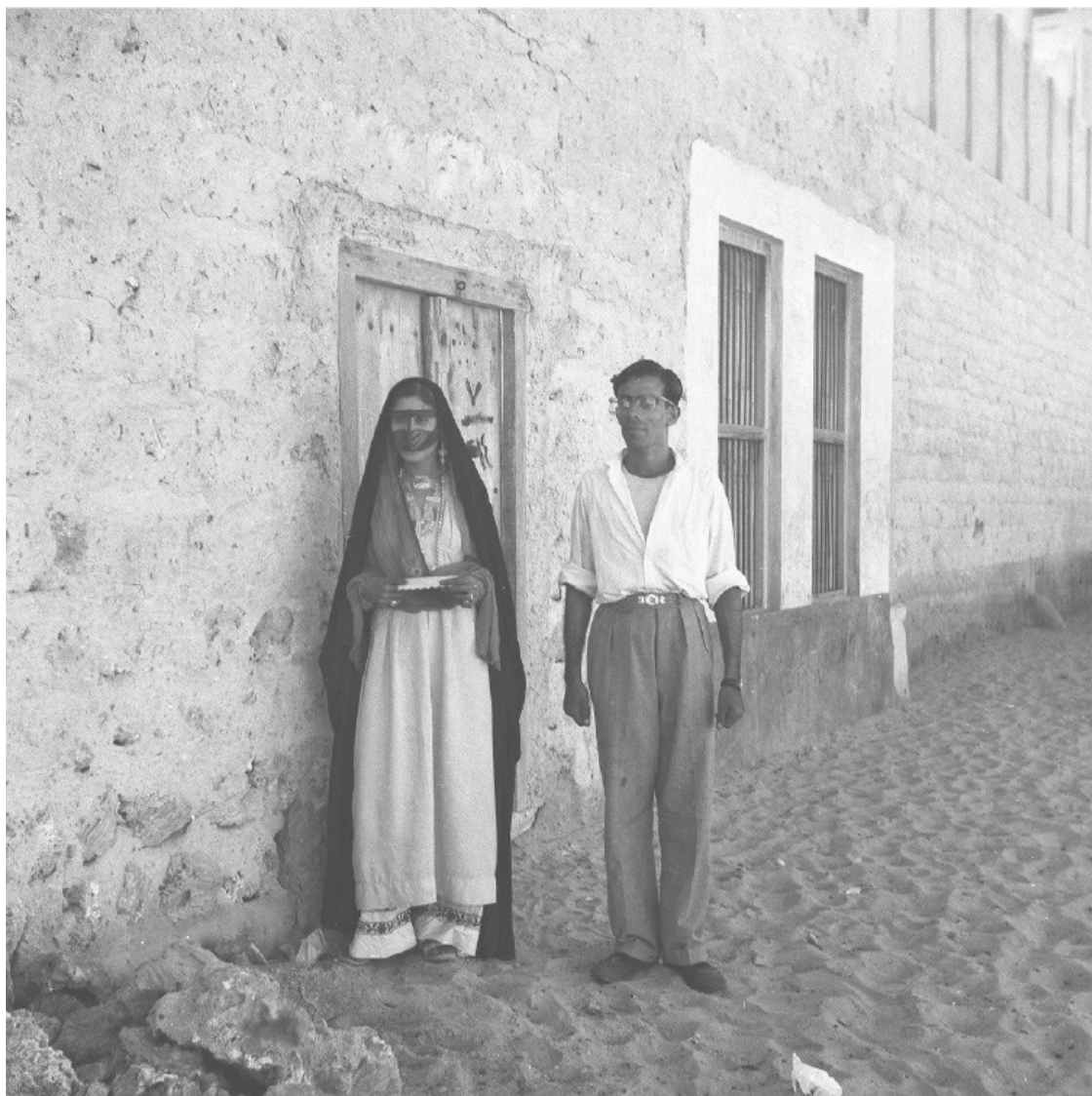
Рис. II. 6

В Дубае нет архива в открытом доступе. Многие документы, казалось бы, должны быть доступны, но найти их не удастся. Нет кадастровых карт, разработанных муниципалитетом на основе плана Харриса, нет первых указов, которые администрация издавала для поддержания порядка в городе. Те, кто соглашался поделиться воспоминаниями, избегали рассказов о том, что могло бы быть неправильно истолковано. Некоторые вещи звучали с оговоркой «не для печати», но это были не скандальные, а легко объяснимые случаи – неудивительно, например, что правитель быстроразвивающегося города, находившийся под влиянием Великобритании, вынужденный считаться с мнением иностранных экспертов и поддерживать баланс местных политических сил, может иногда проявить темперамент. Историю Дубая приходится собирать из черновиков, намеков, обрывочных сведений и редких сохранившихся документов. Казалось бы, модернизация, особенно с упором на порядок и организацию, должна была бы оставить за собой огромный архив. Возможно, в том, что письменных свидетельств почти не сохранилось, можно усмотреть проявление политической воли правителей, которые хотели оставить в сознании людей только один образ города – современный и процветающий.