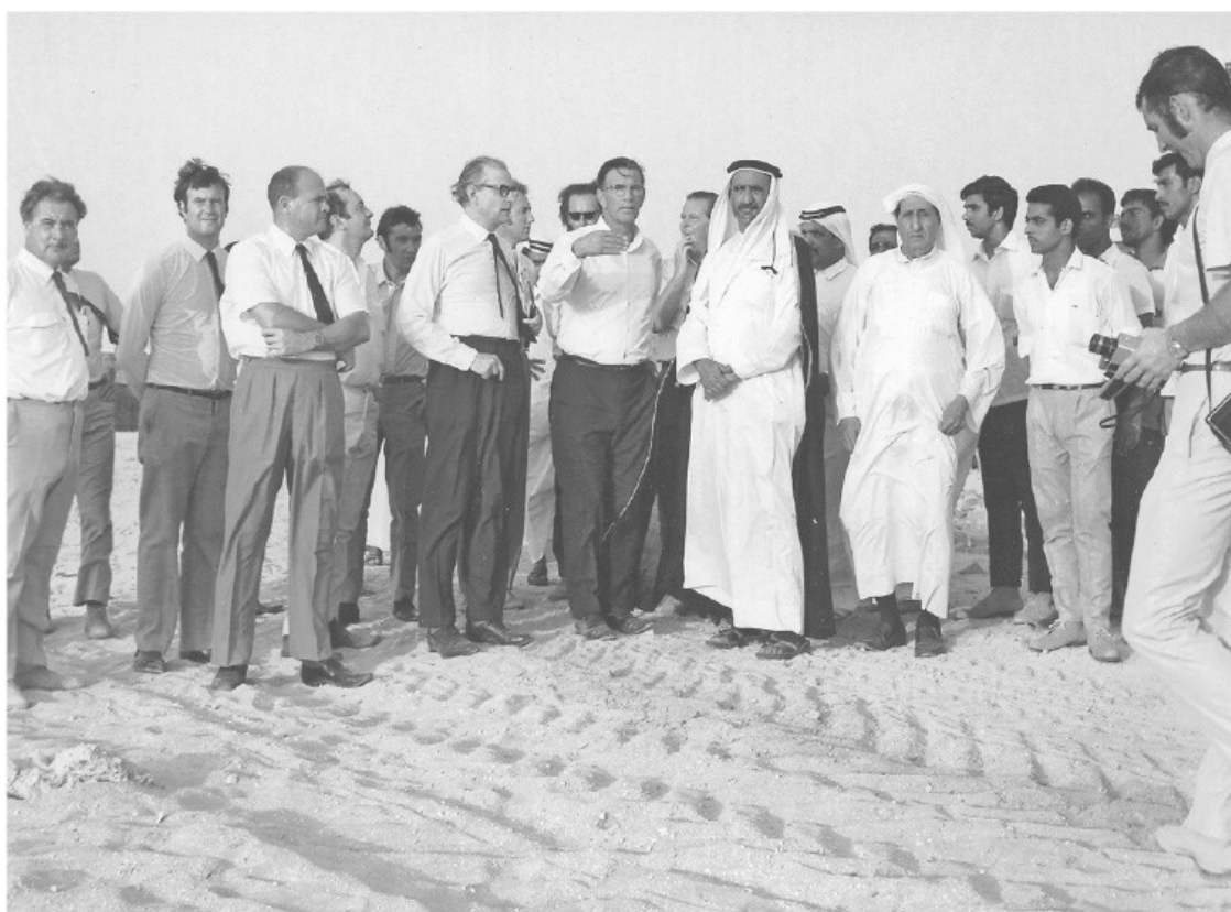
Рис. П. 7

Существует также архив Джона Харриса, который хранится у него дома и в лондонском офисе. Поговорить с Харрисом удалось только один раз, так как он скончался в 2008 г. К тому же Харрис пережил несколько инсультов, что повлияло на точность его воспоминаний. К сожалению, возможность узнать его сторону истории из первых уст упущена, но многое можно понять из его проектов, фотографий, рисунков и писем. Также он оставил записи лекционного курса, в котором эпизодически упоминаются интересующие нас события.