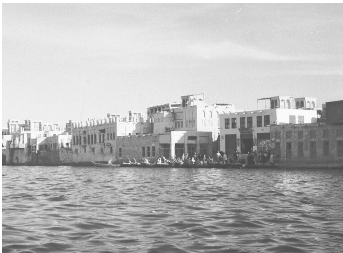
Рис. П. 1

Считается, что модернизация как централизованный проект, реализуемый властью, началась в Дубае, когда это было санкционировано МИДом Великобритании, – к тому времени, когда в Дубай прибыл первый политический агент по имени Кристофер Пири-Гордон, то есть в 1954 г. До этого британские офицеры, которые должны были наблюдать за городом, делали это с борта одного из кораблей, дрейфовавших в паре часов хода от побережья Дубая 8 . Деятельность Пири-Гордона не принимала крупных масштабов, он ограничивался незначительными улучшениями вроде создания передвижной больницы и вопросов изыскания точек для бурения водяных скважин. Такие вопросы не требовали разработки глобальной стратегии развития города – да и можно ли было назвать городом это поселение кочевых бедуинов и рыбаков 9 ? Но само прибытие политического агента было явным предвестником грядущих перемен. Первым шагом модернизации политическое агентство считало внедрение современного правительственного аппарата, которого в Дубае не существовало. Модернизация происходит не по волшебству, а в результате строгого следования установленному порядку, и в тот знаменательный летний вечер в Лондоне Харрис стал размышлять, какую роль он мог бы сыграть в этом предприятии.