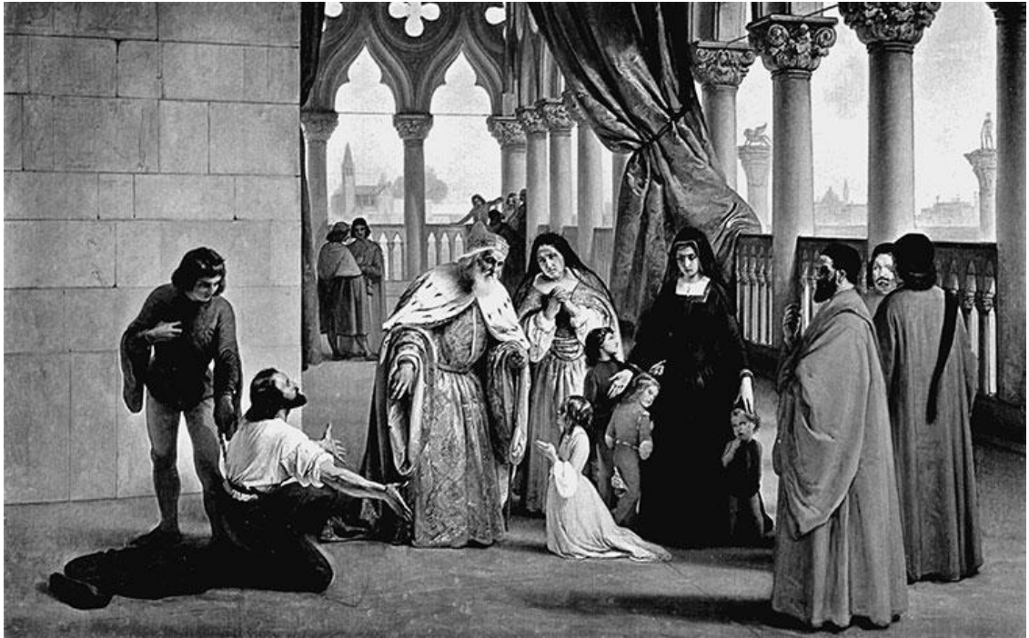
Дож Франческо Фоскари. Художник Франческо Айец

В 1796 г. вторжение войск Наполеона Бонапарта в пределы Венецианской республики ознаменовало ее крах. В 1797 г. Большой совет объявляет об упразднении Венецианской республики. Солдаты наполеоновской армии хозяйничают в городе, многие ценности перевозятся во Францию. Однако осенью этого же года Франция уступает город и всю провинцию Австрии. Венеция навсегда теряет свою независимость, а ее Арсенал, некогда крупнейший в мире центр судостроения, приходит в упадок и используется лишь для ремонта кораблей.