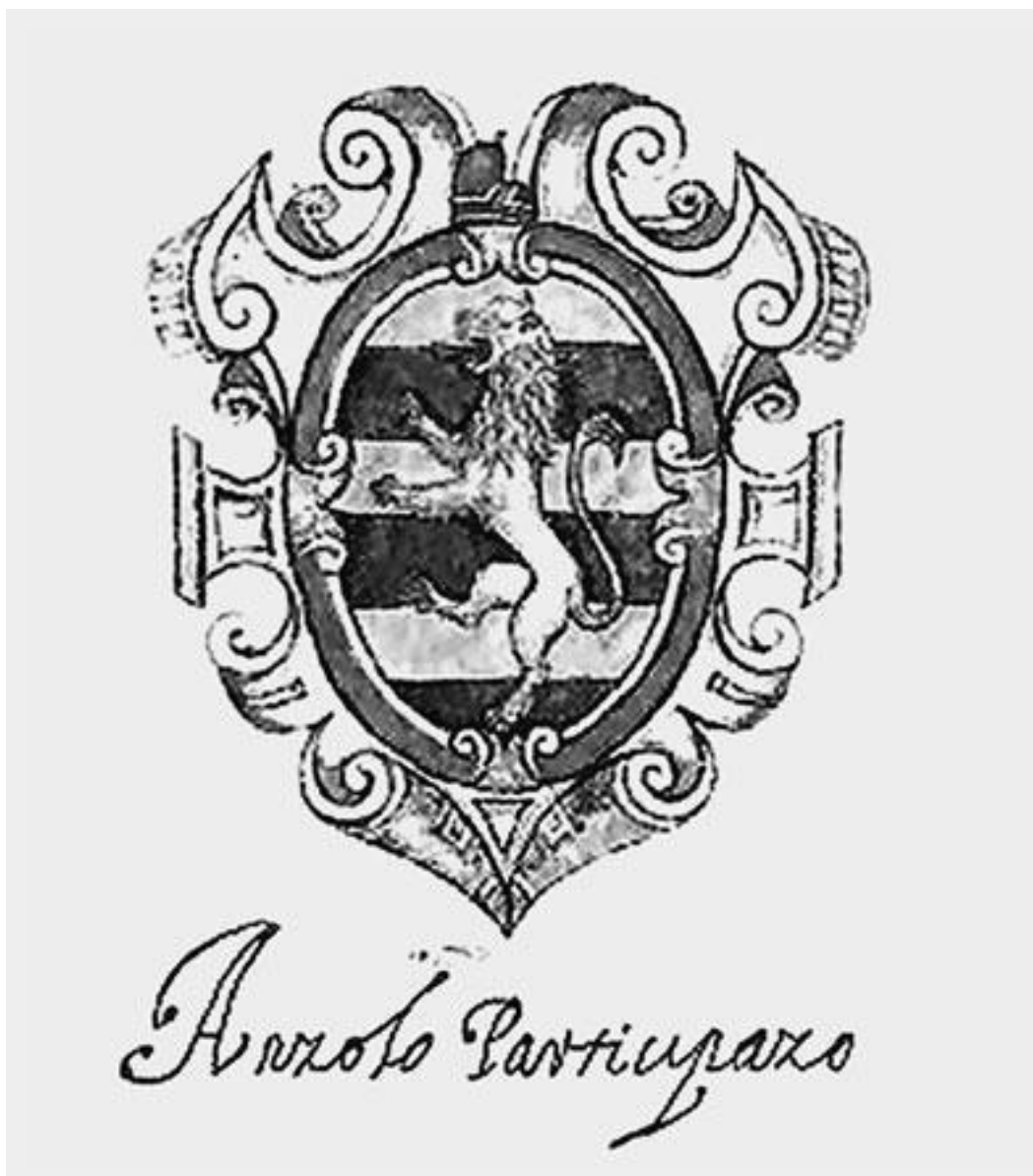
Герб дожа Анджело Партучиано

Даже несколько веков спустя дож Джованни Соранцо (1312–1328) описывал свой городок так: «Построенный в море, совсем лишенный виноградников и возделанных полей».