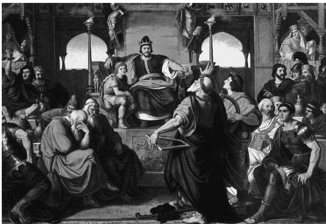
Аттила, владыка гуннов. Художник Мор Тан

В 1000 г. дож Пьетро Орсело II (991-1008) закрепляет владычество Венеции над Адриатикой. Это знаменательное событие ежегодно отмечается празднованием Festa della Sene («венчания с морем»).