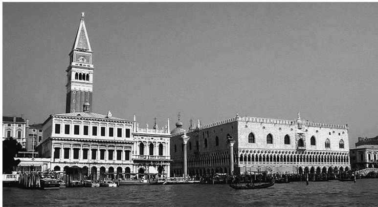
Вид на Дворец дожей и собор Св. Марка со стороны залива

Там множество музеев, где воображение поражают собрания картин: Музей-галерея академии, Галерея Дж. Франкетти, Археологический музей, Музей стекла. Многовековая культура Венеции, ее жизнерадостные красочные искусства, романтические страницы истории, богатства, великолепная и разнообразная архитектура, в которой сочеталось влияние Византии, Восточной и Северной Европы, – все это делало Венецию надежным убежищем для художников, мечтателей и поэтов. Здесь бывали Георг Фридрих Гендель (1685–1750) и Кристоф Виллибальд Глюк (1714–1787), Иоганн Вольфганг Гёте (1749–1832) и Джордж Ноэл Гордон Байрон (1788–1824), Жорж Санд (1804–1876) и Альфред