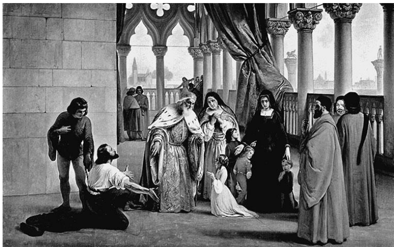
Дож Франческо Фоскари. Художник Франческо Айец

В 1796 г. вторжение войск Наполеона Бонапарта в пределы Венецианской республики ознаменовало ее крах. В 1797 г. Большой совет объявляет об упразднении Венецианской республики. Солдаты наполеоновской армии хозяйничают в городе, многие ценности перевозятся во Францию. Однако осенью этого же года Франция уступает город и всю провинцию Австрии. Венеция навсегда теряет свою независимость, а ее Арсенал, некогда крупнейший в мире центр судостроения, приходит в упадок и используется лишь для ремонта кораблей.