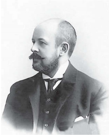
А. П. Извольский

ся прямым нарушением Мюрцштегской программы и давал очевидные преимущества в балканском регионе Германии и Габсбургской монархии. Уже в марте 1908 г.