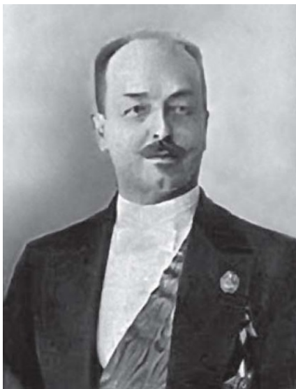
В. Н. Ламздорф

фом и А. Голуховским, в основном повторяло пункты, изложенные в февральской программе. Наиболее важным элементом нового проекта было требование назначить при генерал-инспекторе двух гражданских агентов (по одному от России и Австро-Венгрии). Под руководством обеих держав должна была проводиться реформа жандармерии, а также преобразование административных и судебных учреждений.