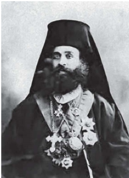
Митрополит Герман Каравангелис

Аналогичным образом действовала греческая сторона, сочетая пропаганду национальной идеологии через школьное дело и просветительские общества с вооруженной борьбой партизанских отрядов. Для греков борьба за Македонию была важнейшей составной частью осуществления великой идеи – объединения всех исторических греческих земель в одно государство и восстановления Византийской империи. В 1894 г. в Греции была создана патриотическая организация Εθελκγ] етацта (Национальное общество), целью