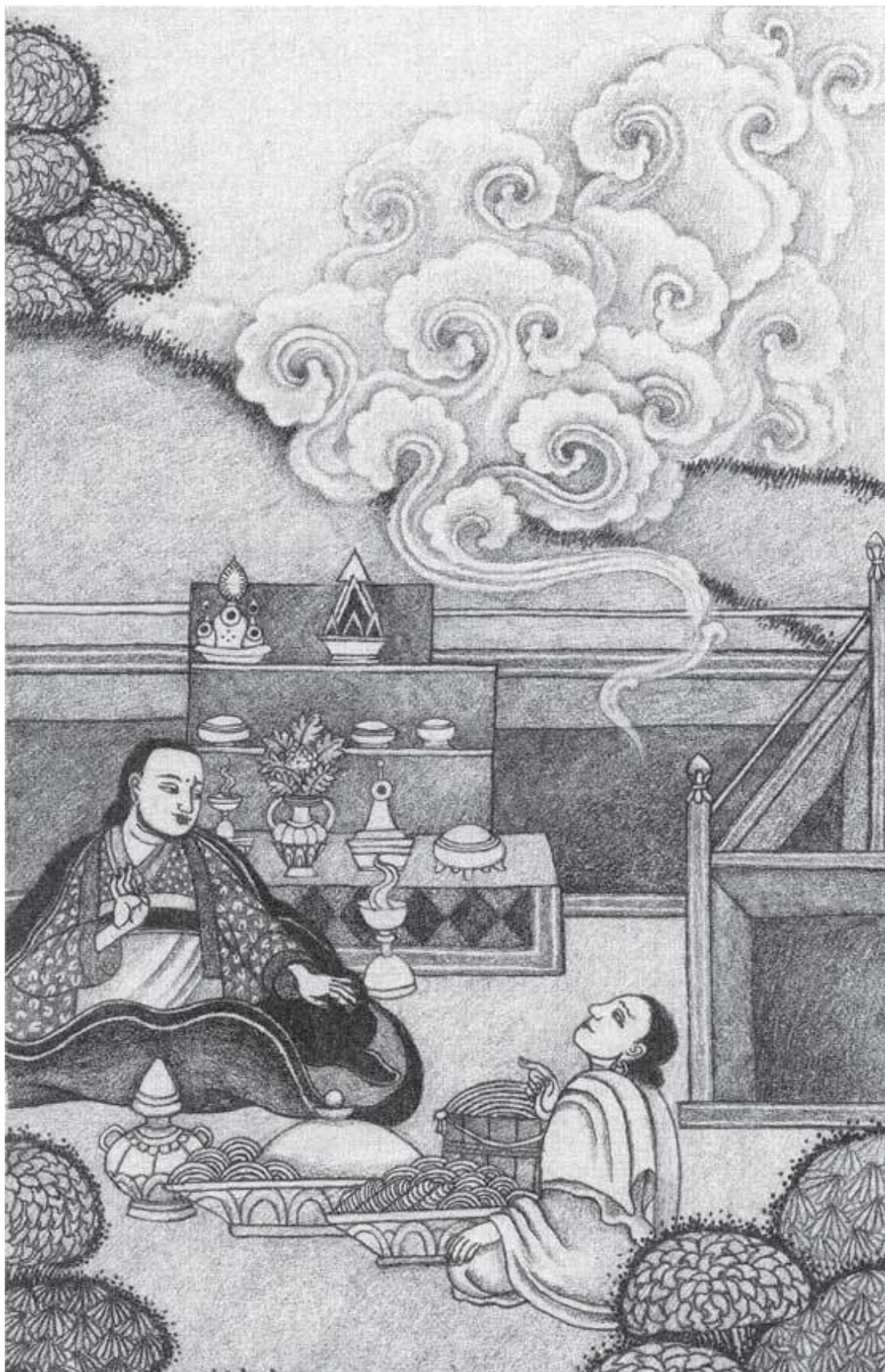
Миларепа описывает Марпе свой первый опыт, полученный в медитации