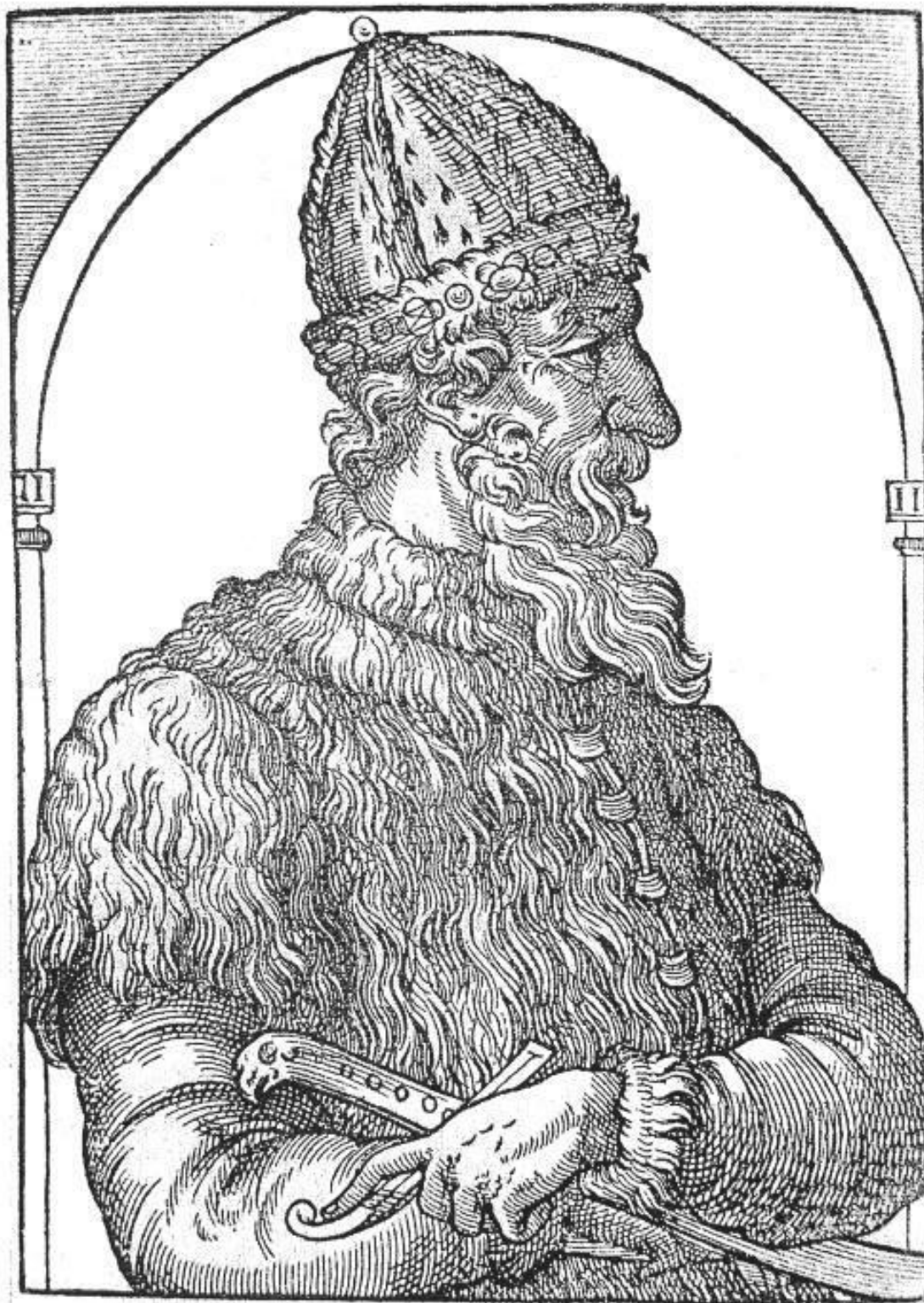
Рис. 1. Иван III Васильевич.