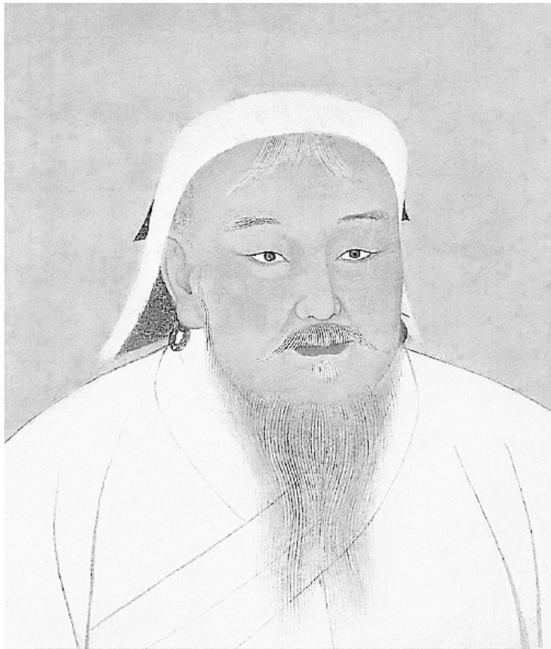
Портрет Чингисхана. Из коллекции портретов монгольских ханов и хани, хранившихся в императорском дворце в Пекине. XIII–XIV вв.