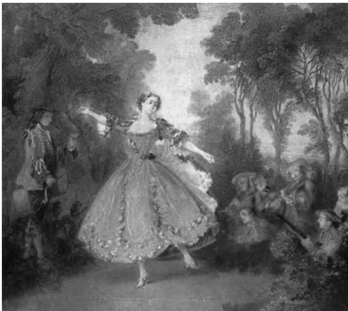
Мари Камарго. Художник Н. Ланкре

15 апреля 1710 года в Брюсселе родилась девочка, которая стала олицетворением женского виртуозного танца для первой половины восемнадцатого века. Ее звали Мари-Анн де Кюпи де Камарго. Отцом ее был испанец-музыкант, который вовремя обнаружил у нее способности к танцу. А первым учителем стал дед.