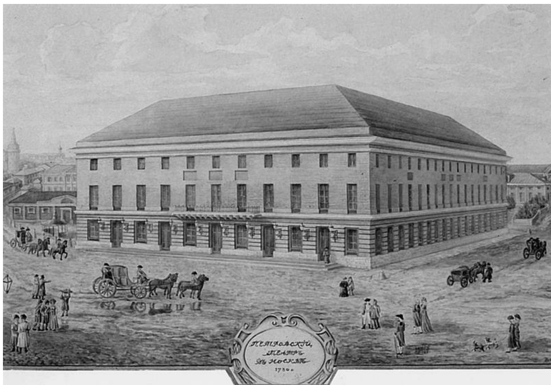
Петровский театр. Гравюра XVIII в.