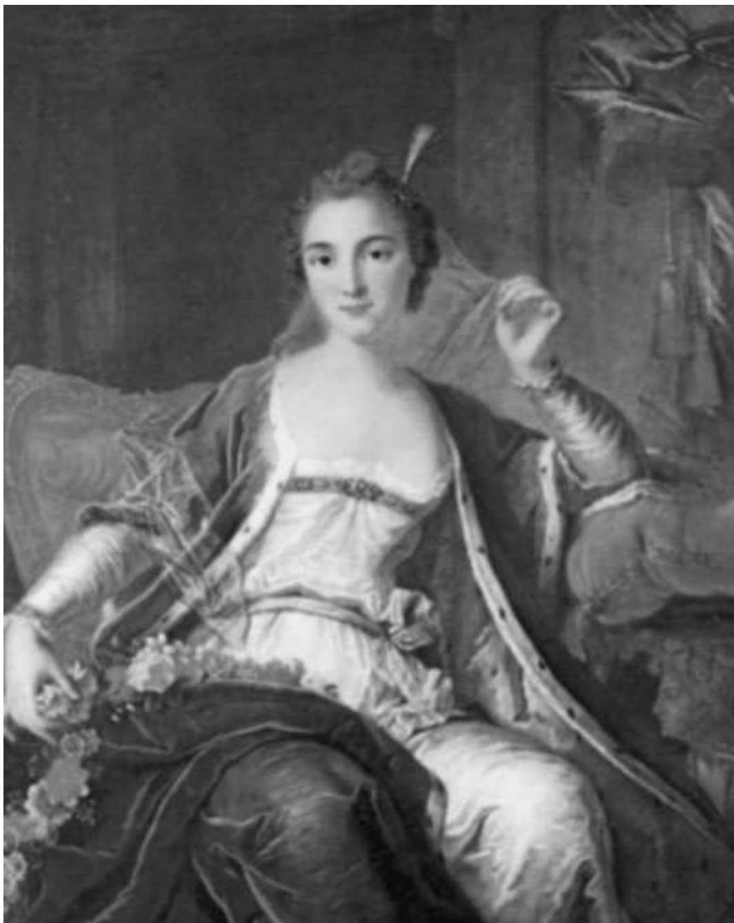
Мари Салле. Художник М.-К. де Ла Тур

Именно это и требовалось брату и сестре Салле – ведь вольные труппы, давая спектакли в провинции, сталкивались со всевозможными запретами. Случалось, что им позволяли дать спектакль, в котором есть и сюжет, и сложные отношения героев, но не позволяли петь и декламировать, тогда вся надежда была на танец и пантомиму. Вскоре, кстати, этот запрет появился и в Париже – «Комеди Франсез» восстановила свою давнюю монополию на драматические спектакли, и ярмарочные театры имели право наделить речью только одного из персонажей.