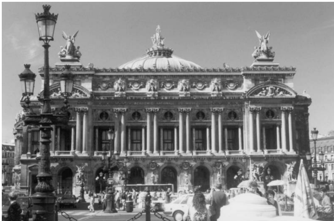
Здание Парижской оперы

Известный публицист барон Гримм в 1753 году в памфлете «Маленький пророк из Боемишброды», созданном в защиту итальянской оперы, написал о танцовщике, которому тогда было 56 лет: «На сцену вышел человек, и все закричали: чакона! чакона! Тот не произносил ни слова, а я им любовался, потому что он позволял рассматривать со всех сторон свое тело, руки и ноги, был красив и продолжал быть красивым, пока кружился, а имя ему было Дюпре». Недаром этого человека называли «бог танца». Но его же Новер, бывший его учеником, называл в «Письмах о танце» «прекрасной машиной с превосходной организацией, которой, однако, недоставало души».