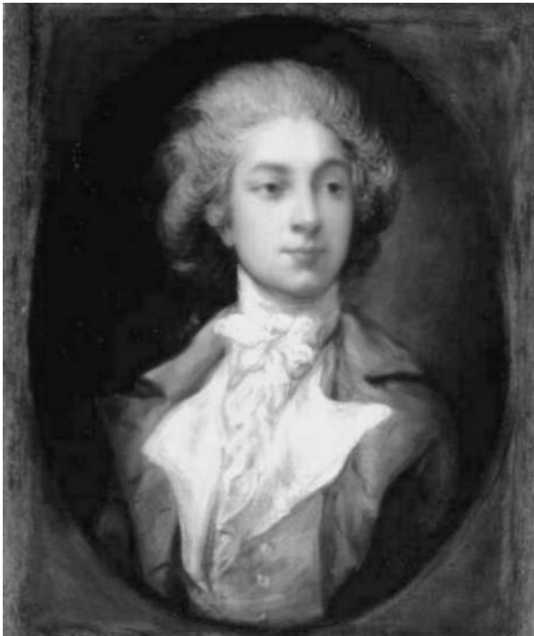
Огюст Ветрис. Художник Т. Гейнсборо