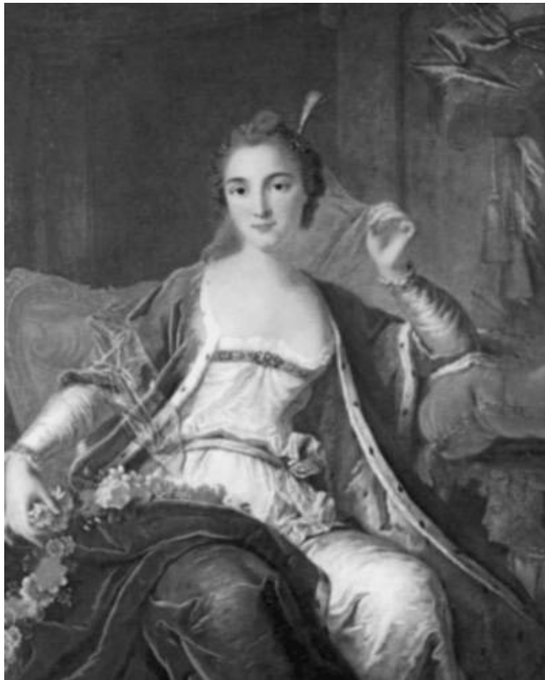
Мари Салле. Художник М.-К. де Ла Тур