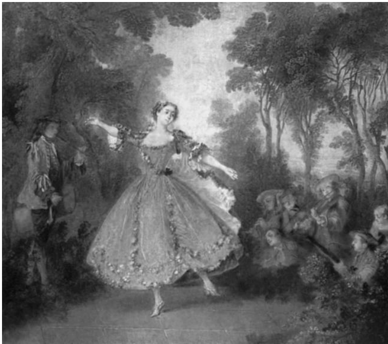
Мари Камарго. Художник Н. Ланкре

Сперва малышку приглашали выступать в домах местной знати. Затем несколько дам собрали деньги, чтобы отправить Мари-Анн в Париж – учиться у знаменитой Франсуазы Прево. К тому времени Прево была ведущей танцовщицей Королевской академии музыки и танца – кстати, этот «титул» она носила чуть ли не четверть века. Для своего времени она