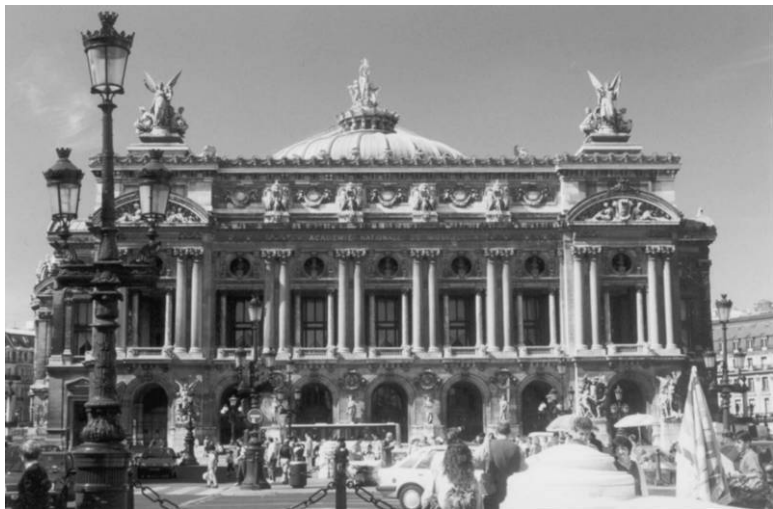
Здание Парижской оперы

чали: чакона! чакона! Тот не произносил ни слова, а я им любовался, потому что он позволял рассматривать со всех сторон свое тело, руки и ноги, был красив и продолжал быть красивым, пока кружился, а имя ему было Дюпре». Недаром этого человека называли «бог танца». Но его же Новер, бывший его учеником, называл в «Письмах о танце» «прекрасной машиной с превосходной организацией, которой, однако, недоставало души».