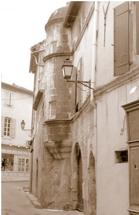
Дом в городе Сен-Реми. Здесь родился Мишель Нострадамус

Жан де Шевиньи, ученик Дора и секретарь пророка, написал латинское четверостишие, помещенное в «Альманахе» Нострадамуса на 1566 г. В нем к предсказателю обращается Аполлон Тимбрийский, покровитель знаменитого в ан-