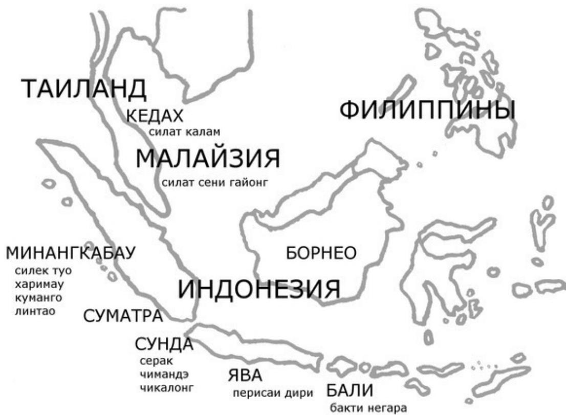
Рисунок 1. Основные острова Индонезии с наиболее известными стилями пенчак силата.