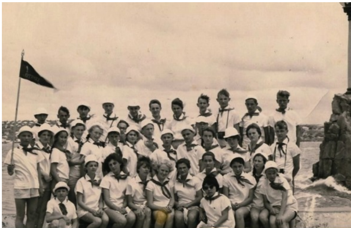
Севастополь, 1964 год.

Фотография в Севастополе сразу заставляет вспомнить, как 50 лет назад нас отговаривали фотографироваться, потому что был ветер, среди ребят тоже были те, кто не хотел, но потом решили, что будем.