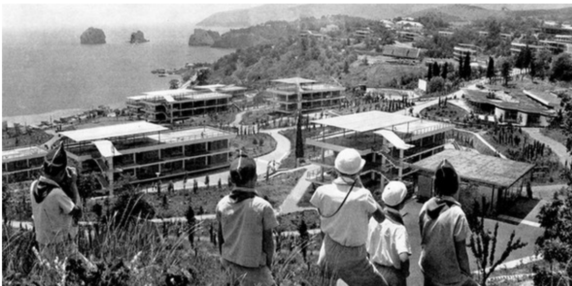
«Прибрежный» в начале 1960-ых.

Понимаю, что нужно двигаться вправо от Аю-Дага, «натываюсь» на решётку забора, за которой красивый, но абсолютно безлюдный бассейн. Непроизвольно вспоминаю споры о необходимости их у моря, голоса «за» (для обучения плаванию), и сегодняшняя реальность, подтверждающая сомнения.