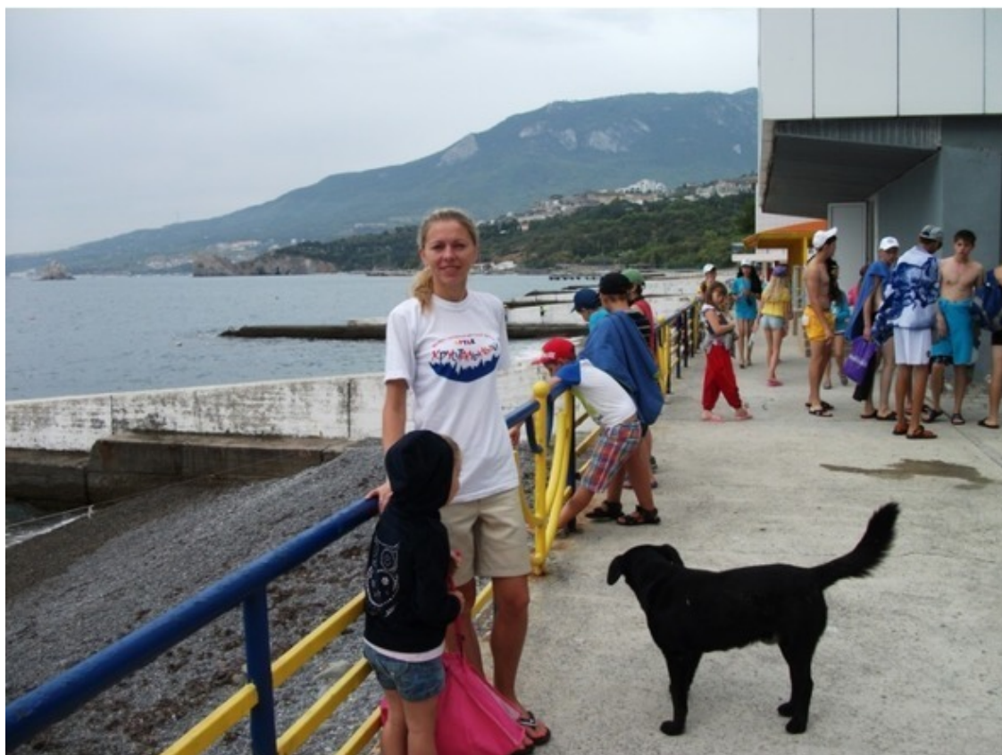
7 сентября 2014 года