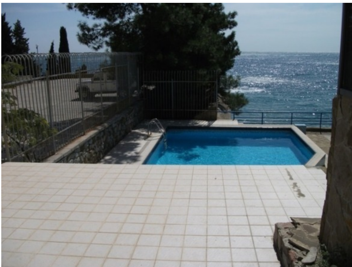
6 сентября 2014 года

Понимаю, что нужно двигаться вправо от Аю-Дага, «натываюсь» на решётку забора, за которой красивый, но абсолютно безлюдный бассейн. Непроизвольно вспоминаю споры о необходимости их у моря, голоса «за» (для обучения плаванию), и сегодняшняя реальность, подтверждающая сомнения.