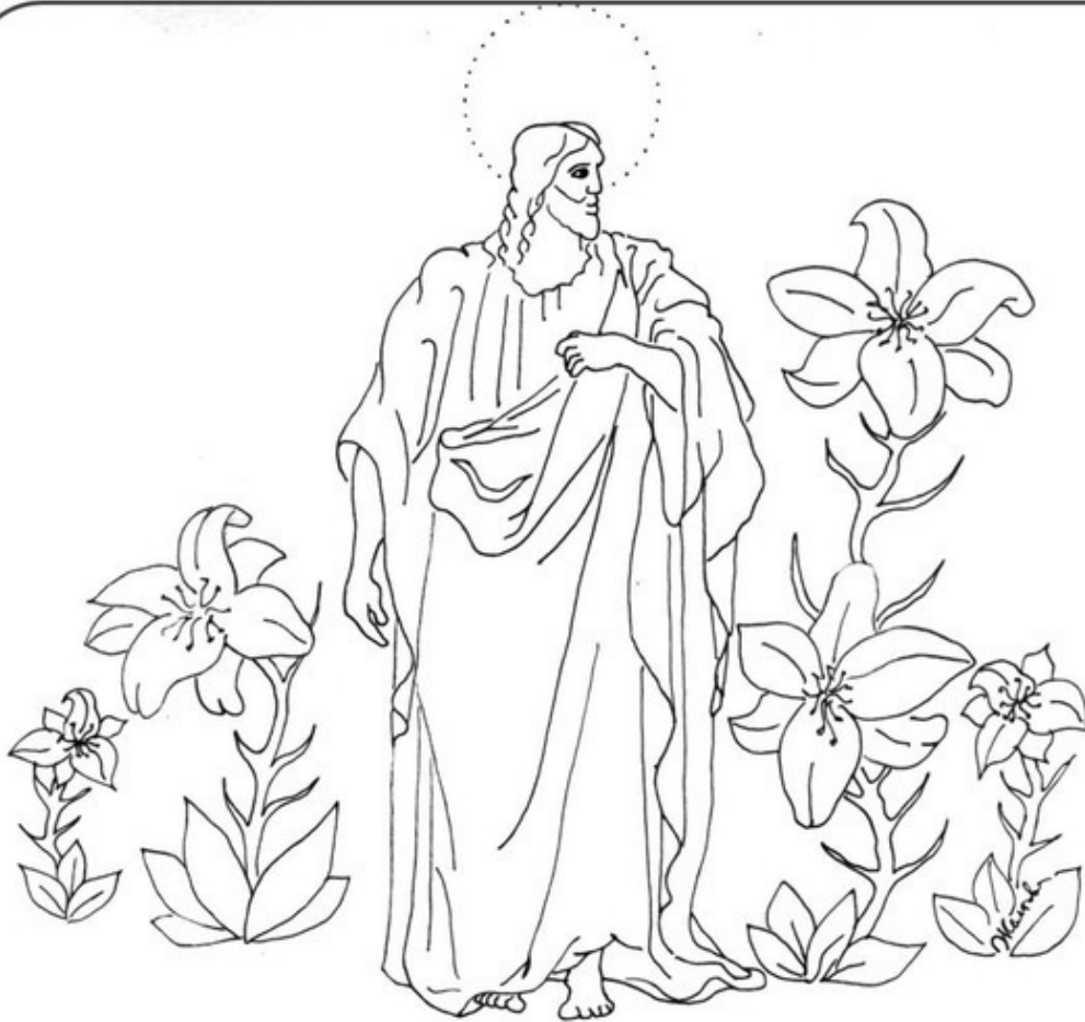
СЛОВНО ЛИЛИИ БЕЛЫЕ