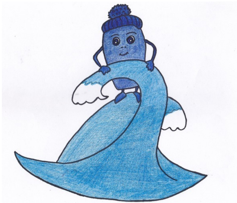
Синий Луч. Рис. А. Дубровиной

А в это время откуда-то из глубины океана вырвался мощный Синий Луч и, нарисовав в воздухе причудливый узор, неожиданно для собеседников, оказался рядом с ними.