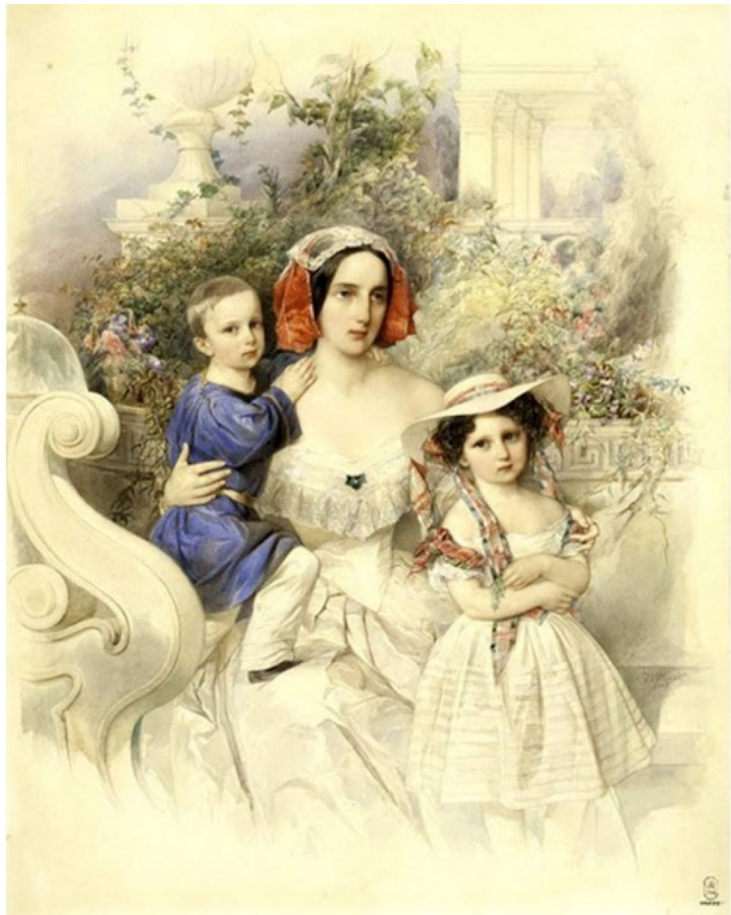
Императрица Александра Феодоровна с детьми, Александром и Николаем. Рисунок М. Зичи. Источник иллюстрации И. Б. Чижова «Чистейшей прелести чистейший образец» М.