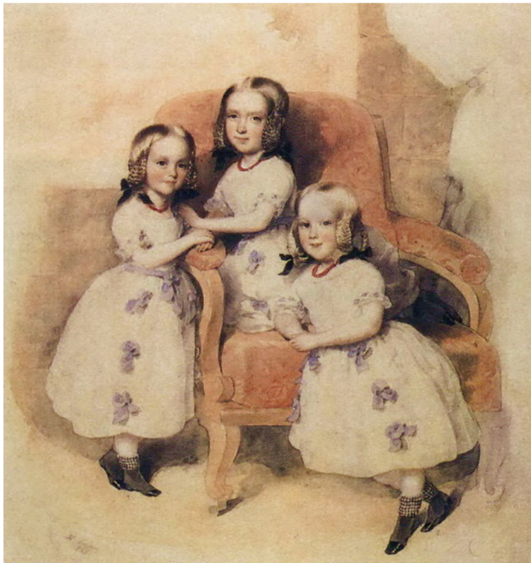
Акварель неизвестного художника. Дети Дантеса. Леония – слева. Личная коллекция автора. Источник: В. Вересаев. «Спутники Пушкина». М. Изд – во «Захаров» М. 2007 год