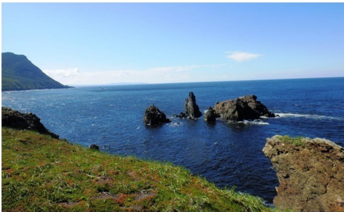
Мысы Марии, Елизаветы, река Воловская.