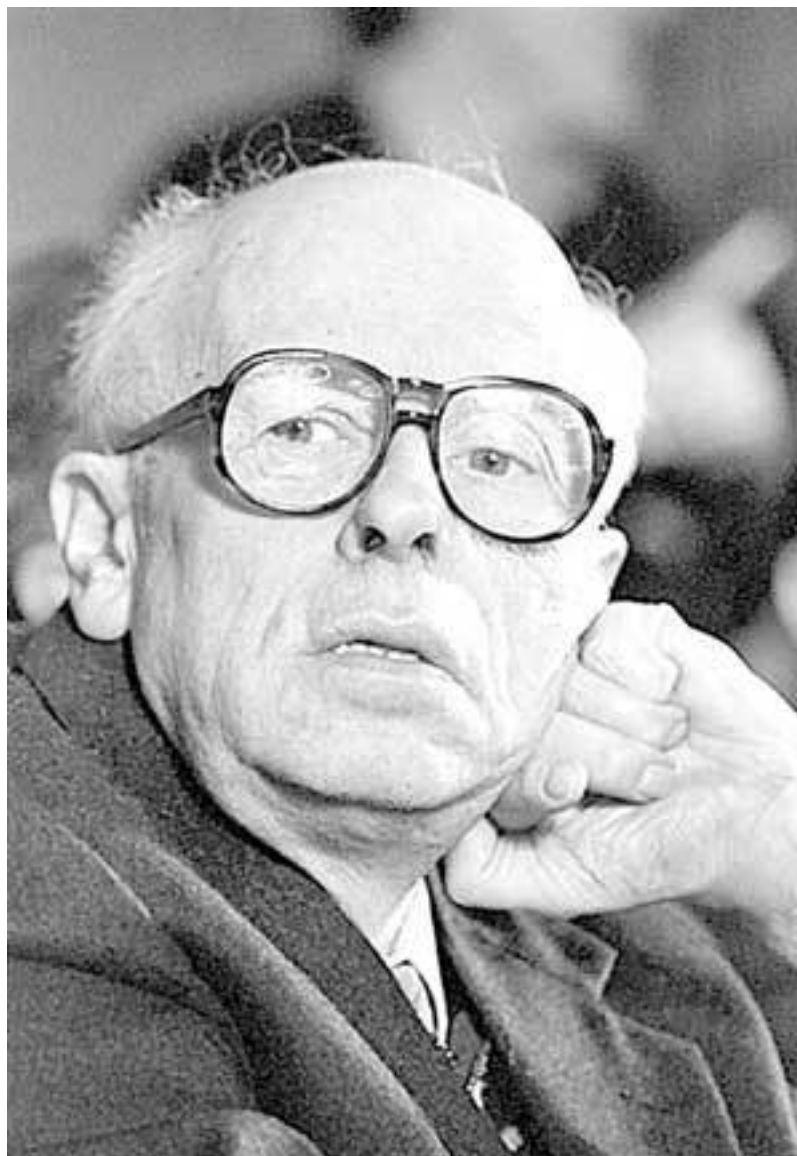
Андрей Дмитриевич Сахаров

Андрей Дмитриевич Сахаров вспоминал, что семья жила в двух комнатах коммунальной квартиры на втором этаже, «...в большой комнате у нас располагались спальня и столовая, стояли школьные столики детей и огромный рояль, занимавший четверть комнаты...». Ранее родители А. Д. Сахарова жили в Мерзляковском переулке (где именно была их квартира, неизвестно), когда 21 мая 1921 г. родился сын Андрей. «Первые полтора года или год мы жили в Мерзляковском переулке, в подвале. Папа носил меня гулять по переулку на нотах (sic!) – коляски не было. Я был „умный“ мальчик и засыпал сразу, как только меня выносили на мороз из сырого подвала», – вспоминал А. Д. Сахаров.