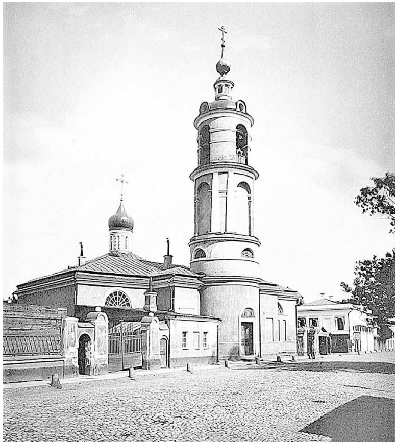
Церковь Св. Спиридона на Козьем болоте

Напротив протянулся по переулку почти на 100 метров жилой дом (№ 2/22) Наркомата путей сообщения, выстро-