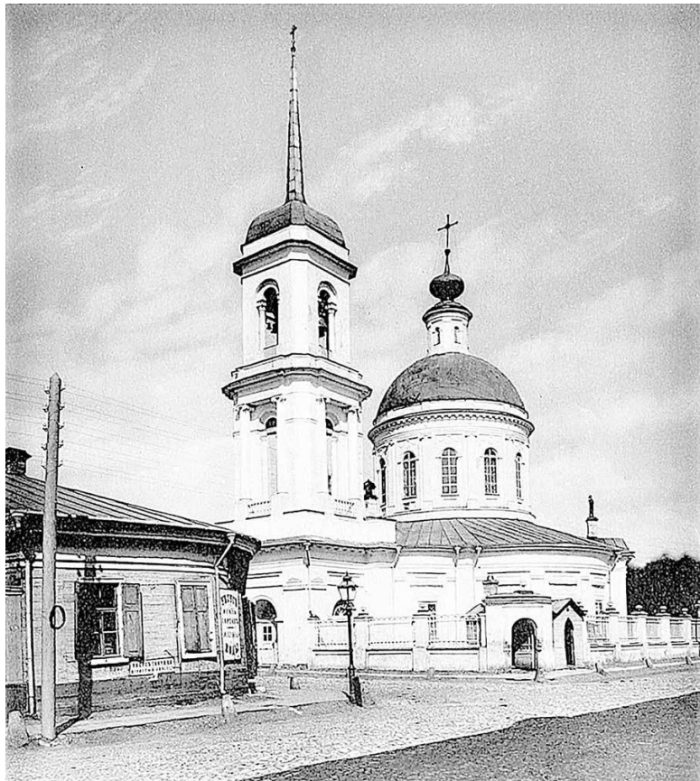
Церковь Георгия на Всполье

Дом № 13 построен в 1864 г. купцом второй гильдии