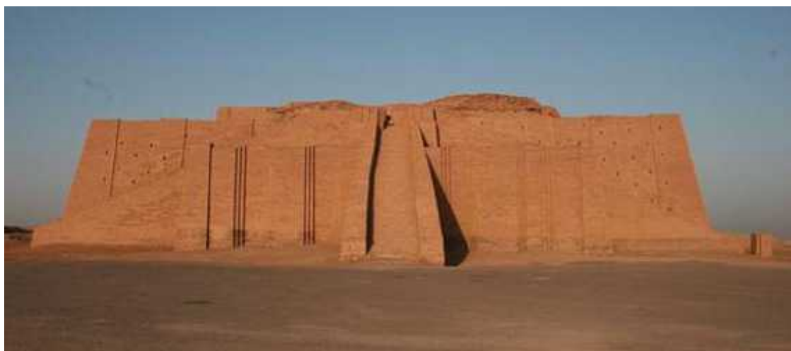
Рис. 8. Древний храм Месопотамии

Ранние протогосударства Двуречья были знакомы с достаточно сложным ирригационным хозяйством, которое поддерживалось в рабочем состоянии усилиями всего населения во главе с жрецами. Храм, выстроенный из обожженного кирпича, был не только крупнейшей постройкой и монументальным центром, но одновременно и общественным складом, и амбаром, где размещались все запасы, все общественное достояние коллектива, в который уже включалось и некоторое количество пленных иноземцев, использовавшихся для обслуживания текущих