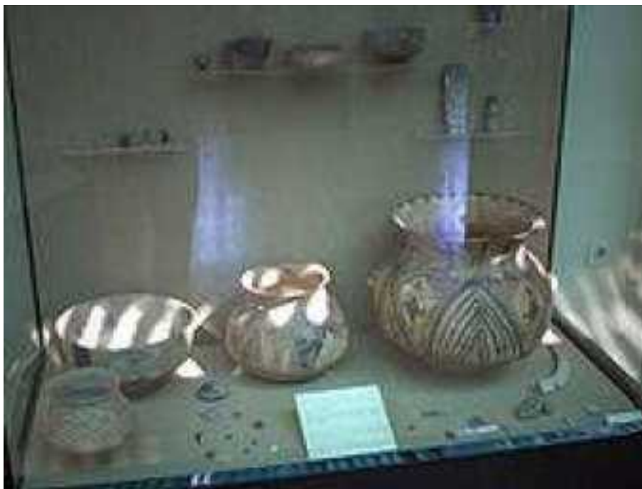
Рис. 2. Керамика