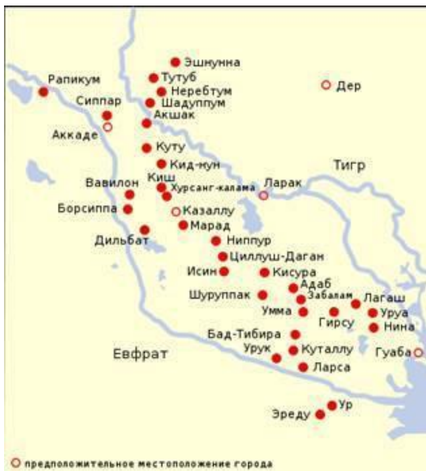
Рис. 7. Древняя Месопотамия