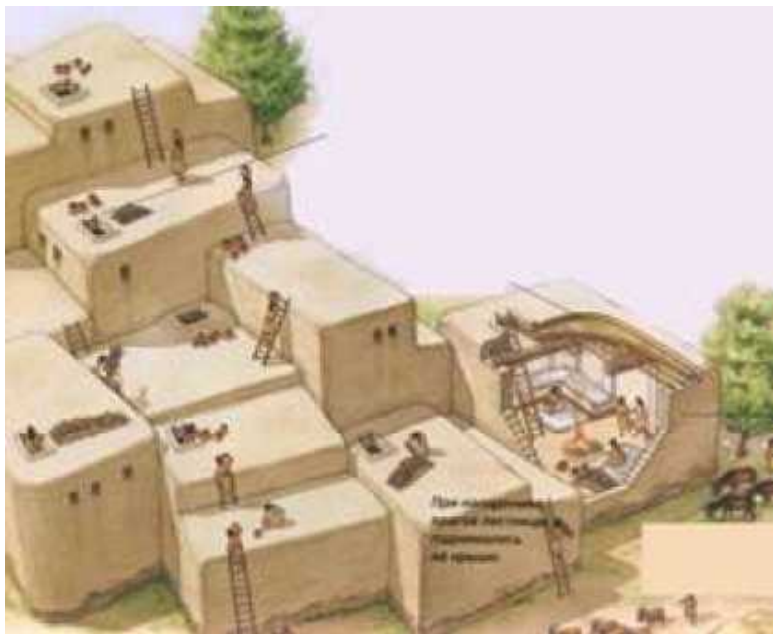
Рис. 3. Возможно, так выглядело поселение