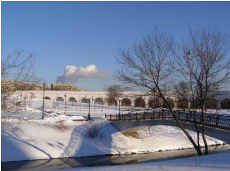
Ростокинский виадук московского водопровода из Яузских болот

Главным мостом большинство москвичей считает Большой Каменный мост, который ведёт к сердцу