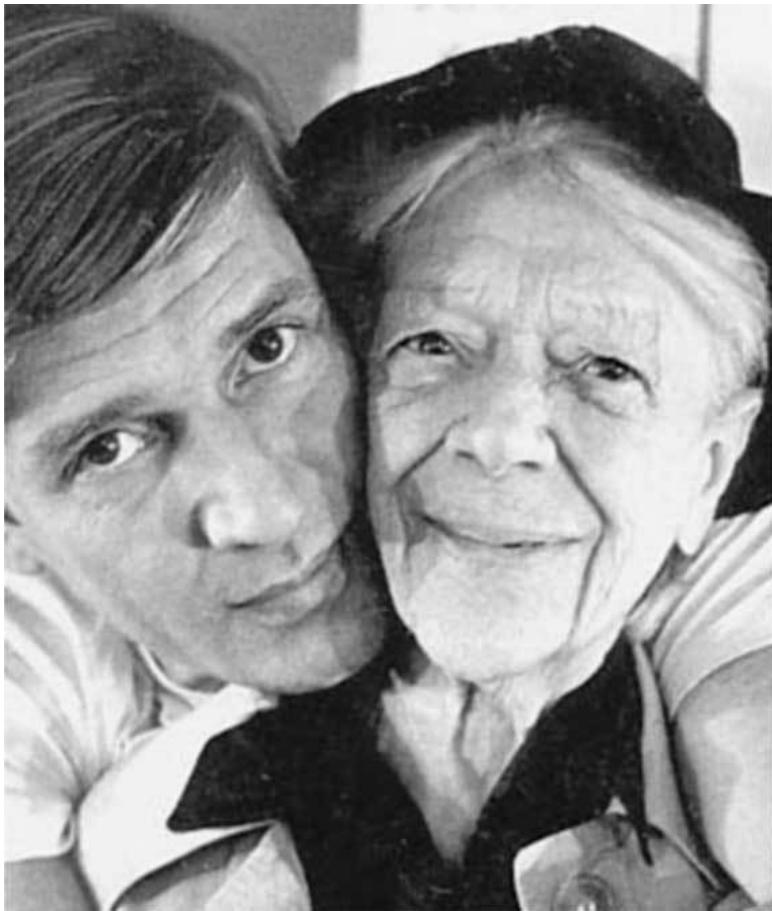
Александр Абдулов и Татьяна Ивановна Пельтцер.

«...я не сижу, не жду, чтобы меня позвали. Сам