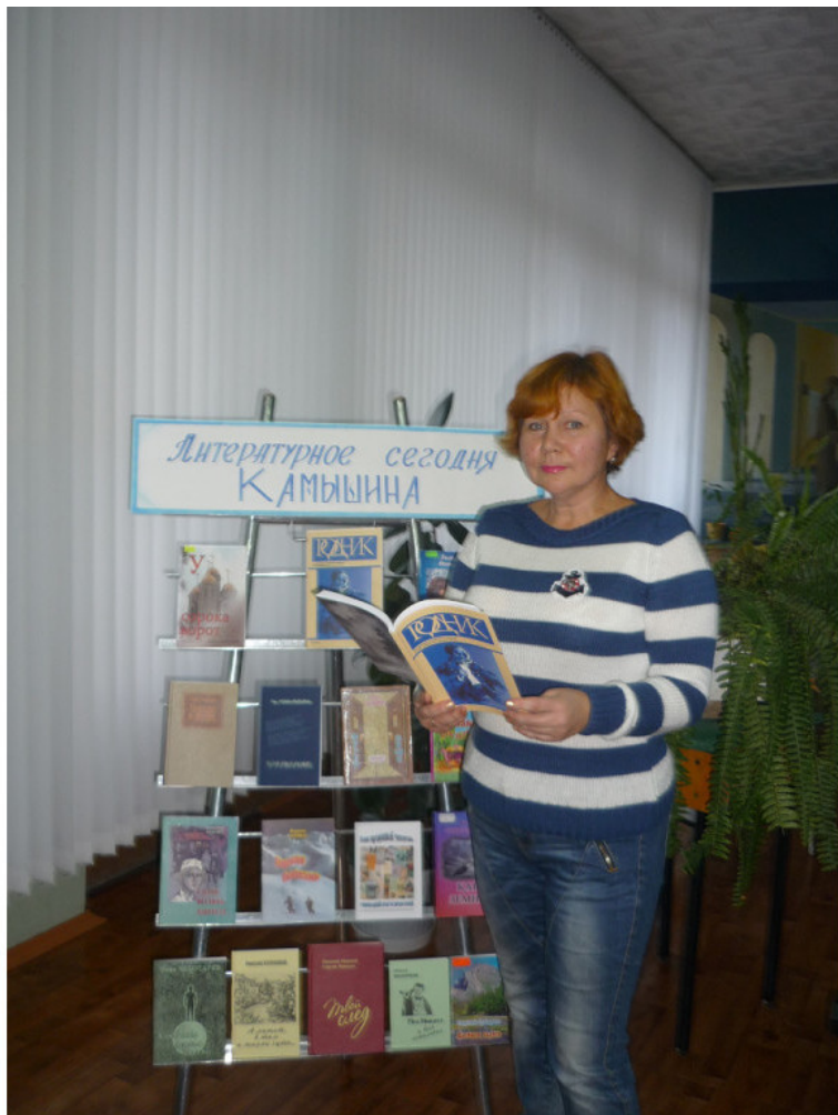
Стихотворения и песни Марины Черных