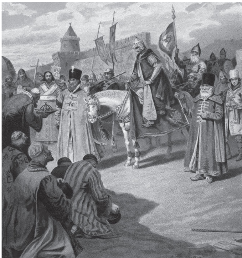
Коровин П. И. Взятие Казани Иоанном Грозным. Кон. XIX – нач. XX в.