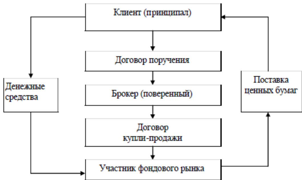
Рис. 1.1. Совершение операций брокером в качестве поверенного

В соответствии с договором комиссии клиент перечисляет брокеру денежные средства на покупку ценных бумаг в полном объеме или частично, согласно условиям договора.