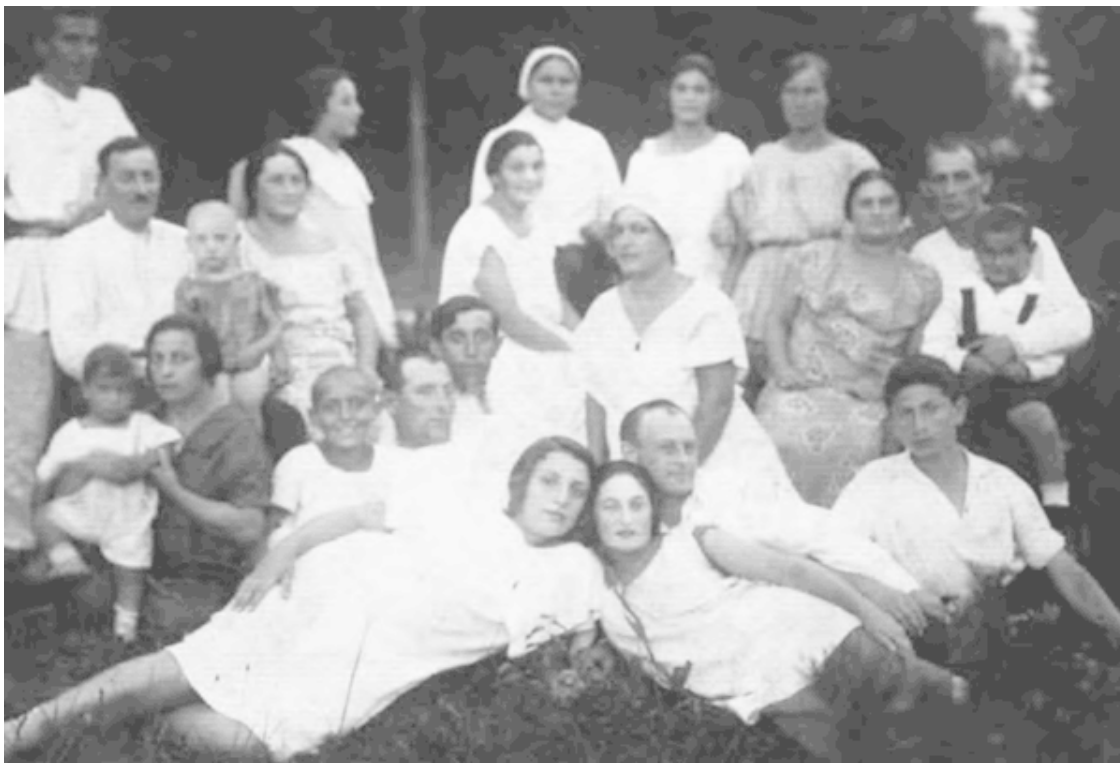
Мои родственники с папиной стороны: дедушка, бабушка, папа и все его родные и двоюродные сестры и братья. Приблизительно 1928 год

жение, что дедушкиным братом был Григорий Наумович Каминский, тоже родом из тех мест, что и мои родственники, один из руководителей ВКП(б), с 1937 года нарком здравоохранения СССР, расстрелянный в феврале 1938 года по приказу Сталина. Однако, кроме некоторого внешнего сходства по фотографиям и сведений о том, что у дедушки действительно был брат примерно того же года рождения, пока никаких доказательств этому не имею. Тетушки мои и мама об этом либо ничего не знали, либо, скорее всего, до конца своих дней боялись что-нибудь сказать о бывшем враге народа, хотя и реабилитированном в 1957 году.