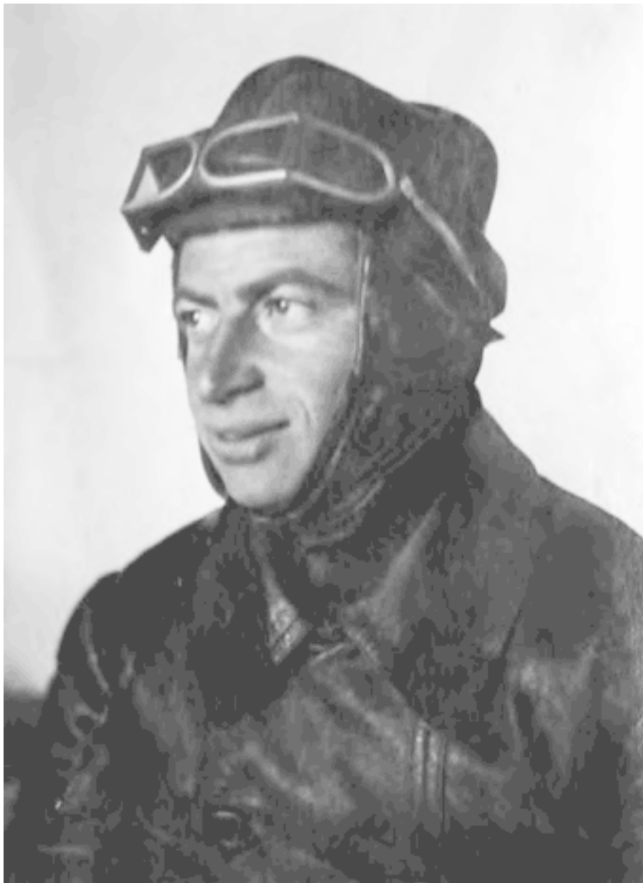
Мой папа – танкист на Дальнем Востоке