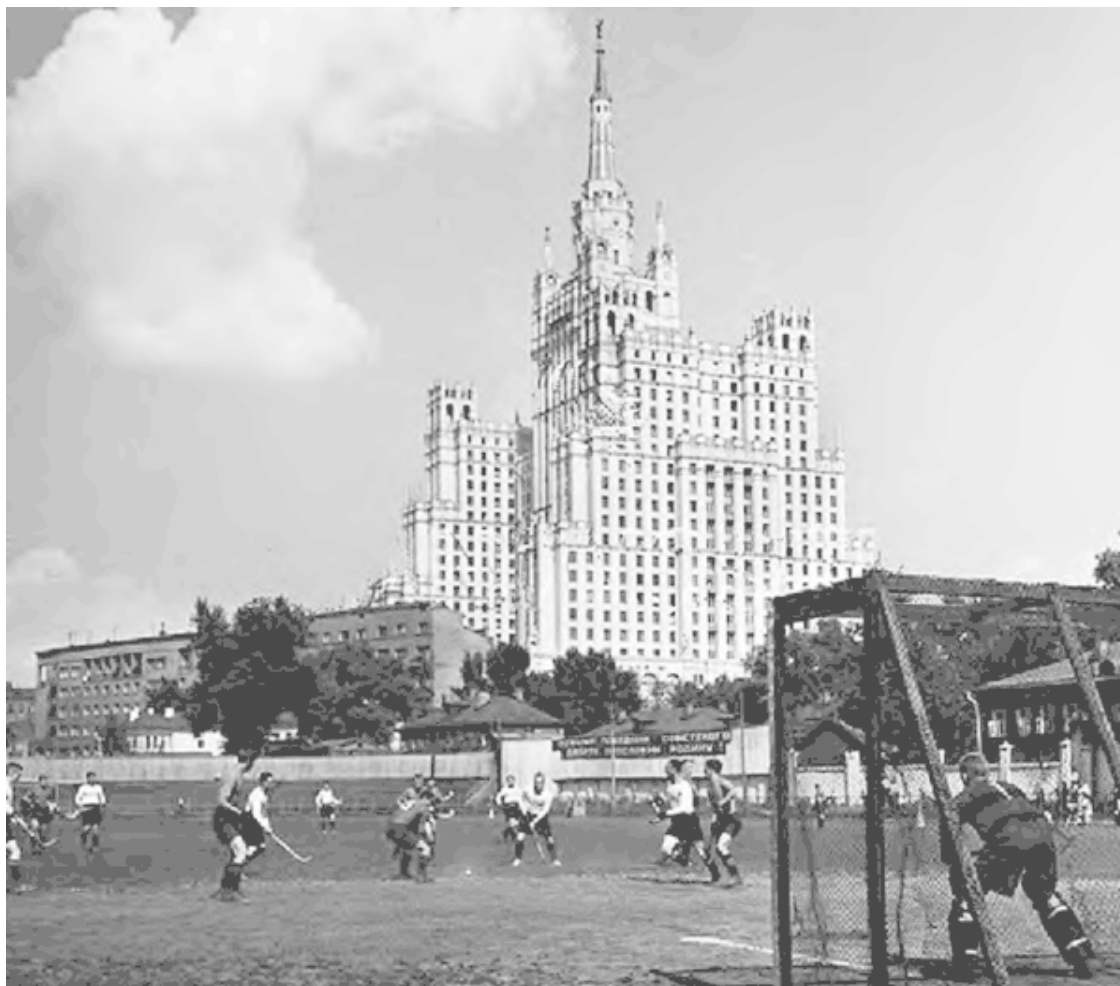
Стадион Метрострой (предположительно 1955 г.).

Увлечение спортом было поистине массовым, и охватывало практически всех моих ровесников. Так, я занимался гимнастикой, сначала в своей школьной секции, затем в районной детской спортивной школе в спортзале студенческого общежития института физкультуры им. Лесгафта, откуда меня направили в городскую детскую спортшколу, размещавшуюся в средней школе № 57 на Арбате, в Староконюшенном переулке. Три раза в неделю пешком ходил на тренировки с Красной Пресни на Арбат через старые арбатские переулки, – это было еще до того, как их уничтожил Калининский проспект. Там я получил второй юношеский разряд в соревнованиях на первенство Москвы. Талантов особых не имел, поэтому, как я считал, для меня это было неплохо.