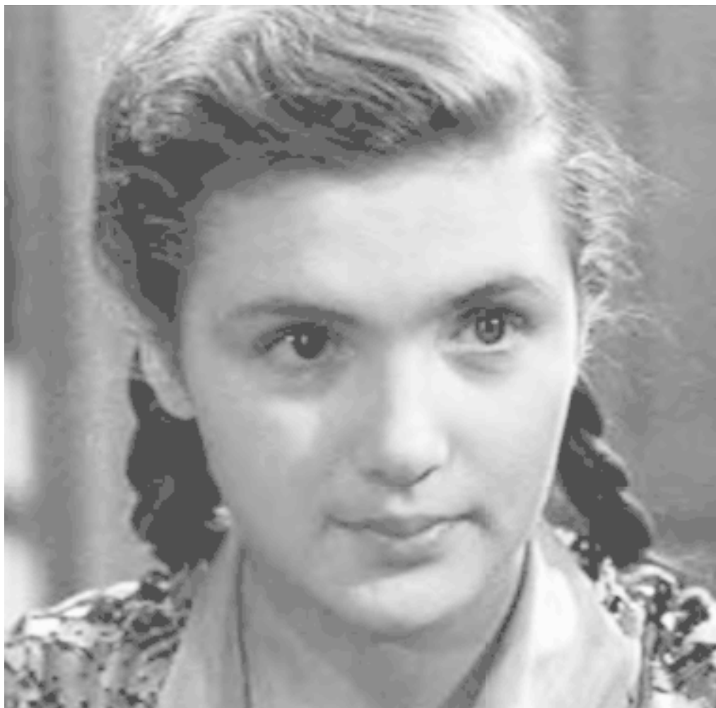
Джемма Осоловская в фильме «Повесть о первой любви»

Жанна была симпатичной девочкой, участвовала, как и мы, в самодеятельности. Кто-то из ее родственников был приобщен к кино, и Жанну пригласили на главную роль в фильме «Повесть о первой любви», после чего она стала кинозвездой. Затем снялась в фильме «Улица полна неожиданностей» с модным в те годы актером Леонидом Харитоновым, вышла за него замуж, родила. Несмотря на столь стремительный взлет, ее жизнь сложилась не самым удачным образом – совсем молодой, ничего не увидев и не узнав, кроме успеха в двух кинолентах, она оказалась с ребенком на руках и пьющим мужем, хотя и кумиром своего поколения. Пример Жанны показал мне обратную сторону актерства, побудил поставить окончательную точку на притязаниях в этой сфере и сделать выбор в пользу техники. Между тем кино сыграло в моей профессиональной судьбе немаловажную роль, но об этом чуть позже.