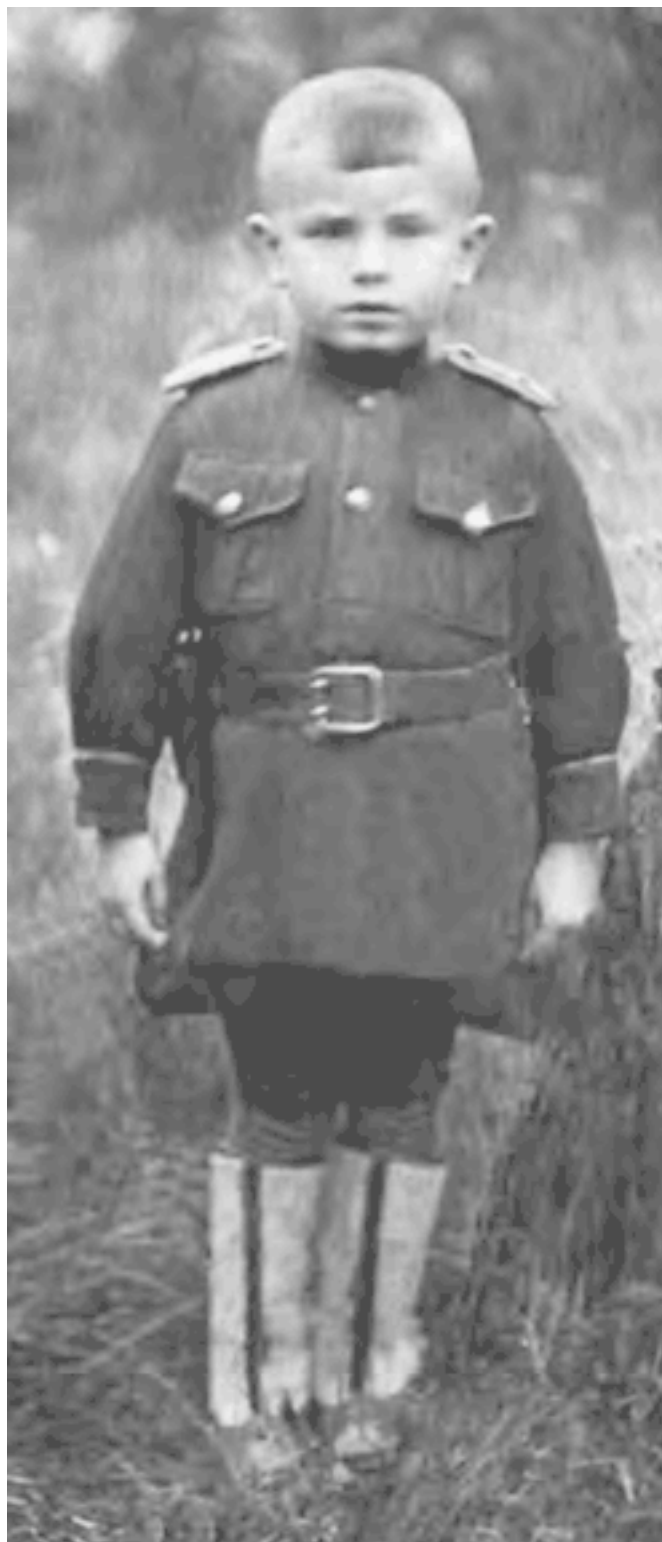
Новая лейтенантская форма мне очень нравилась. 1945 год

Я стараюсь придать и обнинским воспоминаниям какую-то хронологическую последовательность, хотя значения это никакого не имеет, просто так легче вспоминать. Так вот, следующее весьма важное для меня событие, запомнившееся на всю жизнь и послужившее мне хорошим уроком, произошло, видимо, осенью того же года. Дело в том, что в обнинской детской колонии, как и в той, что на Шаболовке в Москве, изготавливались снаряды. А в конце