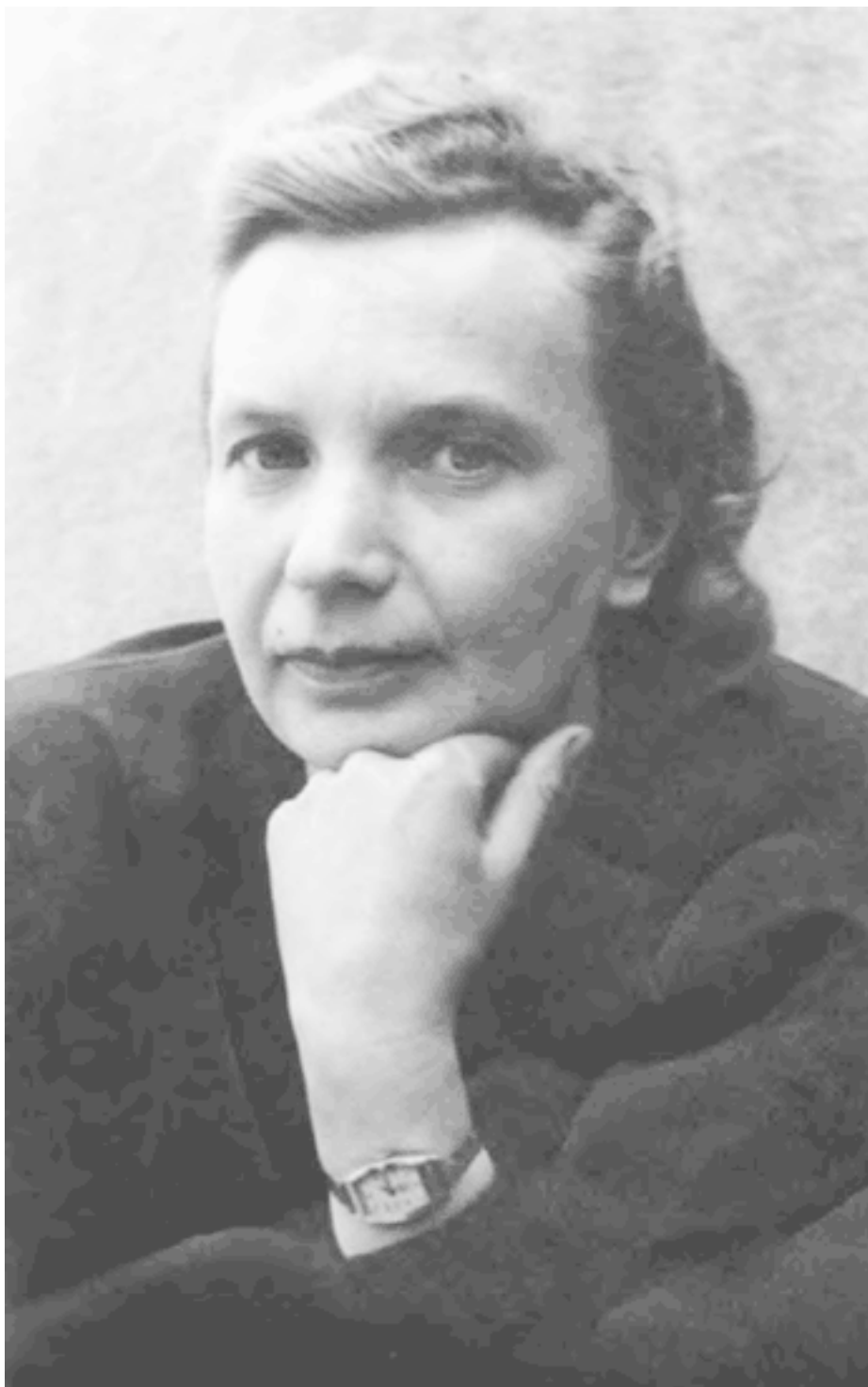
Мама, 1948 год

Часа через два наши машины свернули с трассы, и мои спутники постепенно начали просыпаться. После Венева замелькали знакомые названия: Урусово, Истомино, Подосинки... Но ни одного узнаваемого пейзажа или вида. И вот, наконец, указатель – Шишлово.