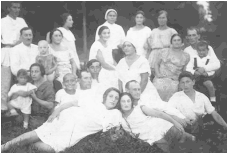
Мои родственники с папиной стороны: дедушка, бабушка, папа и все его родные и двоюродные сестры и братья. Приблизительно 1928 год