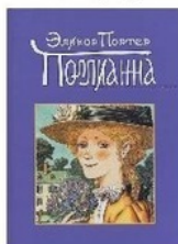
Триада, 2013, М. Батищева,