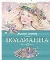
Махаон, Азбука Аттикус 2014 С.А. Магомет