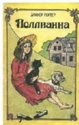
«Два слона», 1992 А.Иванов, А.Устинова