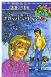
АСТ, Астрель, 2001, А.Иванов, А.Устинова