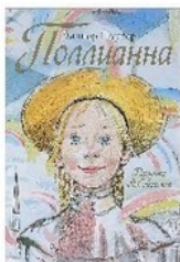
АСТ, 2013 М. Батищева