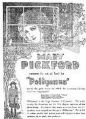
Фильм с Мэри Пикфорд