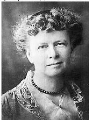
Элино́р Порте́р / Eleanor H. Porter, урождённая Eleanor Hodgman (19 декабря 1868 — 21 мая 1920) .