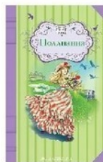
Эксмо, 2016 М.Батищева