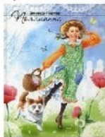
Оникс 21 век, 2013