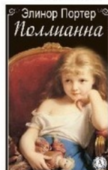
ИП Стрельбицкий 2015, Л.Галичий