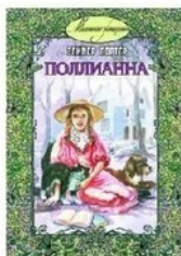
ЗНАС-КНИГА, 2014 А.Иванов, А.Устинова.