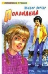
АСТ, Астрель, Транзиткнига 2005 Батищева М.Ю.