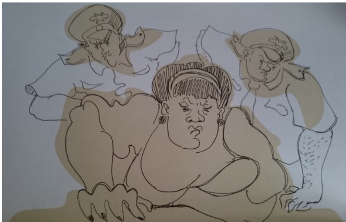
Рисунок Виктория Можарова

– Что в мире творится! Очередной скандал в Думе, в Украине власть делят, в Крыму пенсии повышают, как бы не было войны, – сказала Захару Сергеевичу его жена.