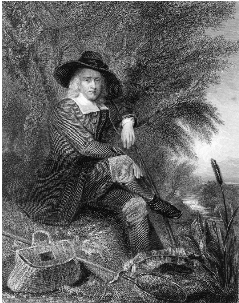
Исаак Уолтон (1658). Гравюра Генри Робинсона по рисунку Джеймса Инскиппинкса (1825)