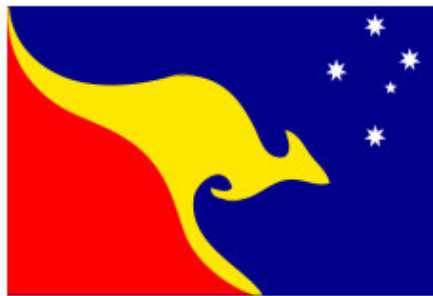
Один из проектов нового флага Австралии