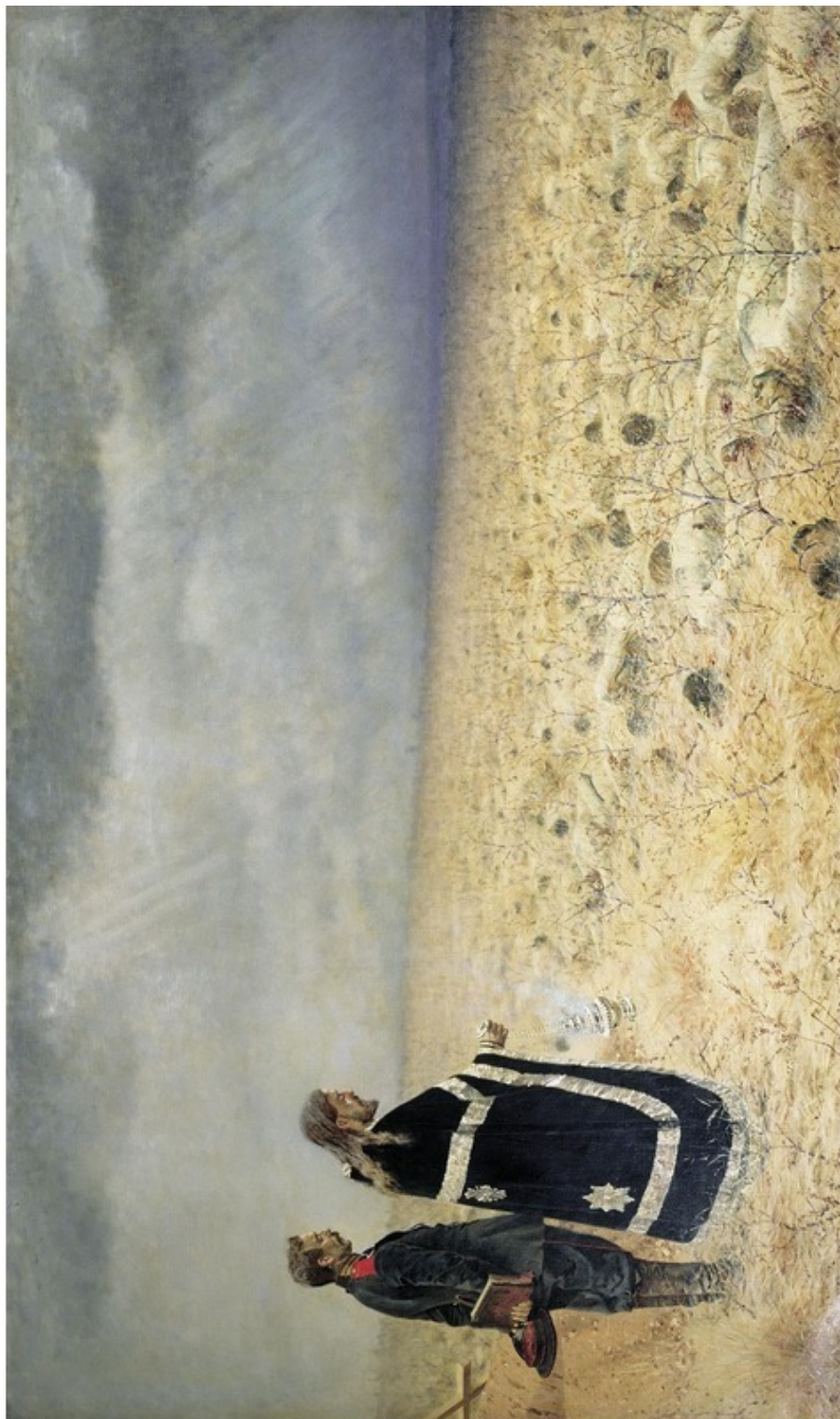
Рис. 5. Побежденные. Панихида по павшим воинам. Худ. Василий Верещагин