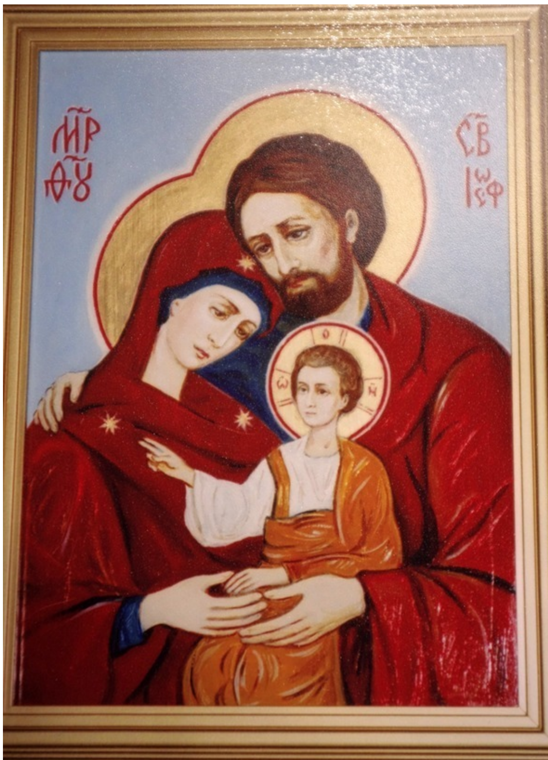
Рис. 3. Святое Семейство. Худ. Ксения Вышпольская (Санкт-Петербург)