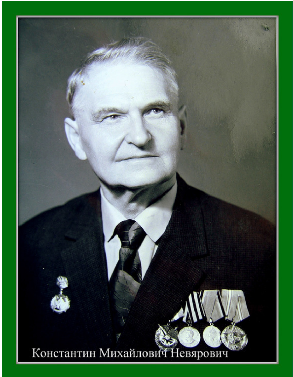
Рис. 10. Портрет отца. Оформление автора

С годами туманнее облик Отца, Бледнеют минувшего краски, Тускнеет портрет дорогого лица, И гаснут мгновения сказки.