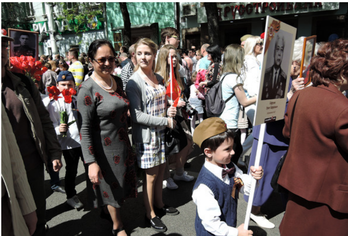
Рис. 8. День Победы. Бессмертный Полк. 2015 г. Воронеж.

Как в мае улицы свежи! Как удлинился час заката! Как ближе стали для души Военных подвигов солдаты! Как зелень возрождает жизнь! В цветенье города и сёла. И кружат над окном стрижи — В мечтах крылатых – новосёлы! В улыбке светится Весна. Всё в ней – любовь, очарованье. Нарядней всех невест она, В лучах купается признанья. Вот праздник Мира отшумел. Страницы юности листаю, Вдали от пут служебных дел Я куст малиновый сажаю... Но всё в преддверии лучей Грядущих праздника Победы. Под звуки маршей и речей Мы вспомним про отцов и дедов. Тот праздник – наши честь и долг Пред миллионами погибших. И вновь пройдет Бессмертный полк