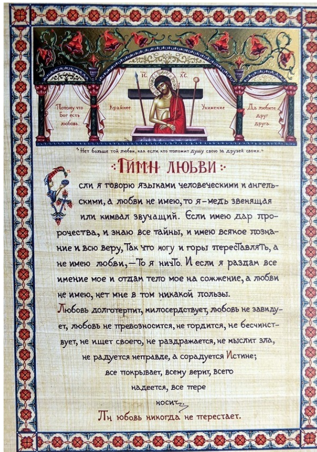
Рис. 1. Гимн любви.