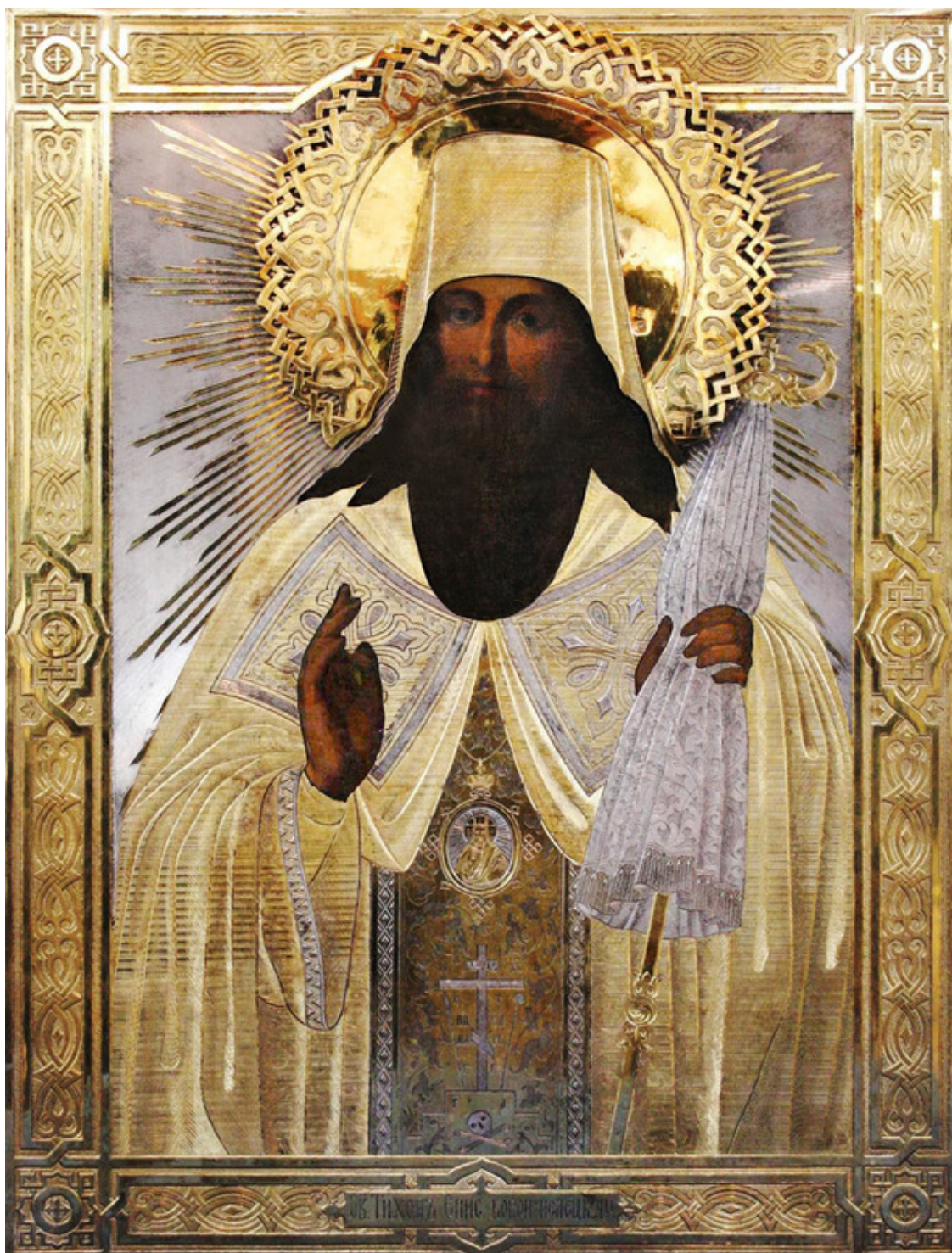
Рис. 2. Портрет-икона святителя Тихона Задонского. Художник Никандр Бехтеев