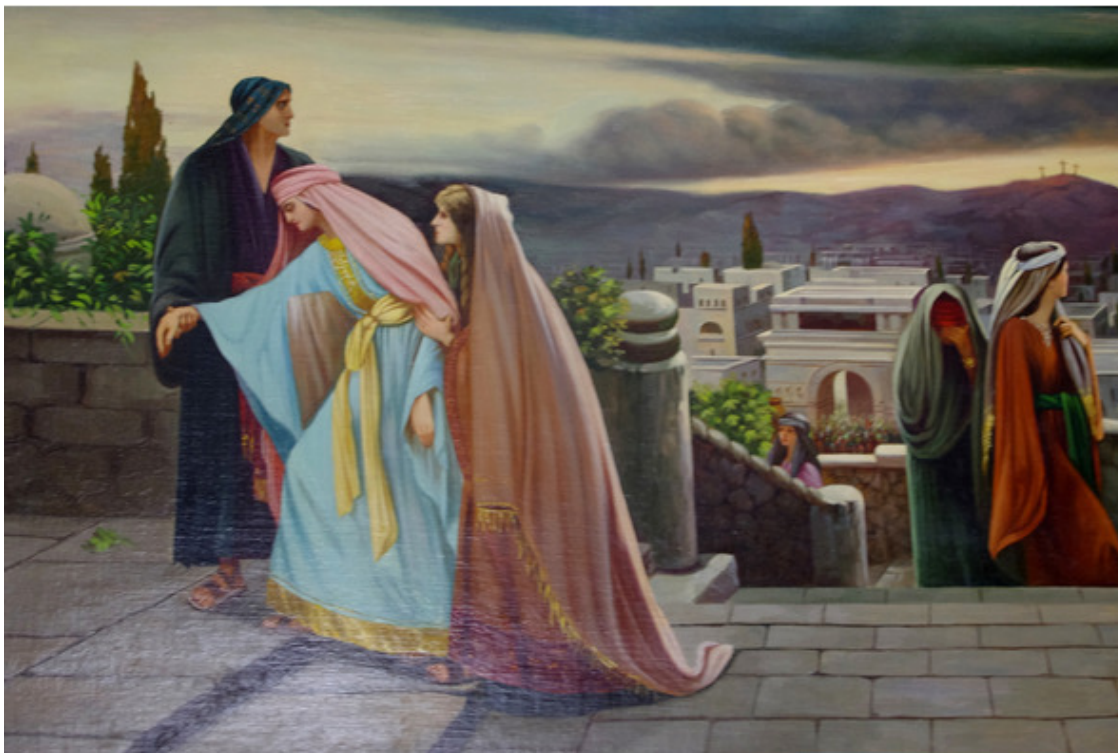
Рис. 4. После Распятия. Худ. Алексей Бирюков. Из собрания картин иеросхимонаха Нифонта (Санталова)

Уже смеркалось. Расходились. Кресты маячили в дали... Казалось, жизнь остановилась. Она ли шла, Ее ль вели? Свершилось века преступленье, Безумство окаянных лет... Она ступала по ступеням, И Ангел плакал Ей во след.