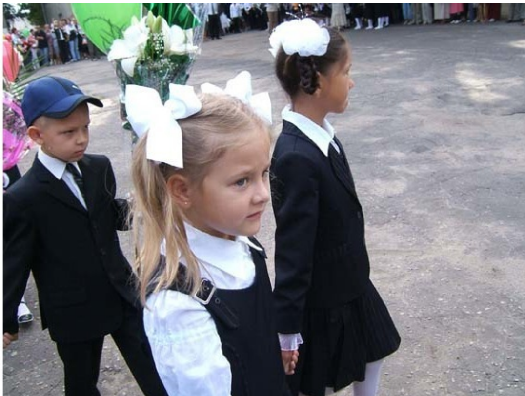
Рис. 9. Первый звонок.

Тихий, погожий, как в школьные годы, Солнечный, тёплый сентябрьский денёк. Вдруг позабылись заботы, невзгоды, Вспомнились школа и первый звонок... Как это было? Давно это было... Память мгновенья о том сохранила... Парты, меж ними прямые ряды, И детвора. Эти школьники – мы. Вот отшумела пред школой линейка, В залы заносят мальчишки скамейки, Море цветов. И на окнах цветы. Сели за парты. В полетах мечты. Голос учителя добрый, но строгий: «Я поздравляю вас, дети, с дорогой, Школьной дорогой, длиной в десять лет. Добрый вам путь! И грядущих побед!