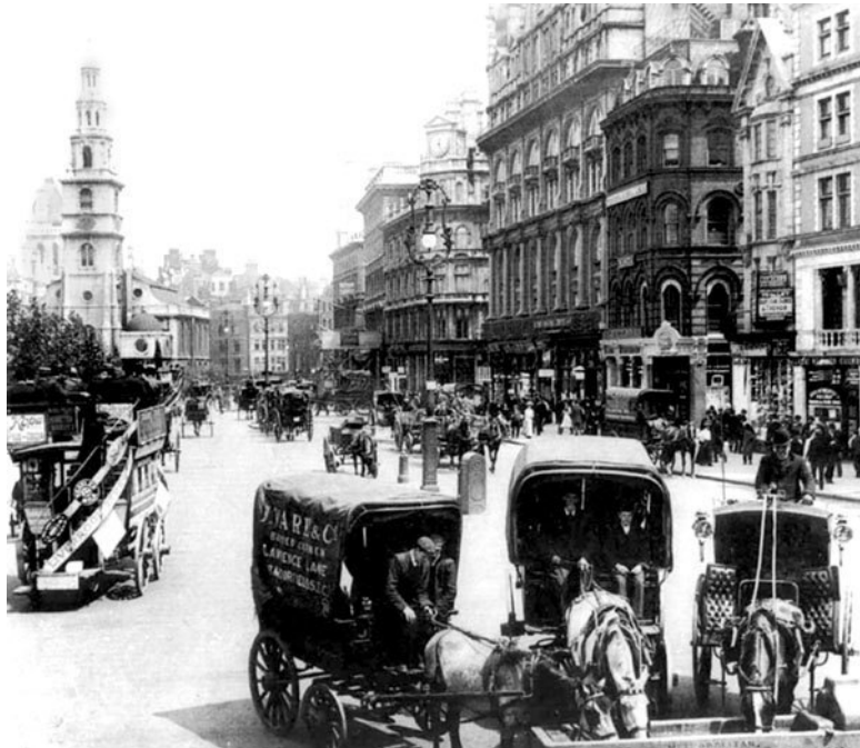
Лондон на старой фотографии