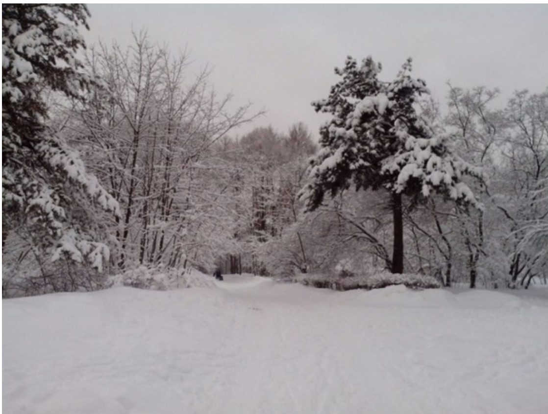
Тропарёвский парк той зимой

не мог, было и стыдно, и легко, как будто я наконец-то признался в преступлении. Ноги сами повернули меня прочь, и я пошёл и пошёл, говоря себе: «всё, слава Богу, всё». Я шёл долго, по пустым, холодным улицам, придумывая на ходу оправдания, радуясь каждой удачно найденной фразе, шёл туда, в темноту парка Тропарева , куда мы летом ездили втроём на весь день, шёл легко, не чувствуя холода и усталости. «Вот, пойду и лягу. И пусть». Шёл мимо черных барачков стройбата, погружаясь в тишину и темень неосвещённого электричеством городского пространства. Было ни капельки не страшно. Вокруг ни души (или это мне только казалось?), только снег хрустел под ногами (может, она пойдёт за мной, кинется меня