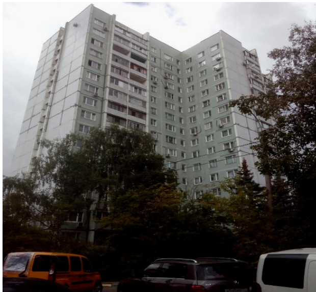
Моё Московское Жилище