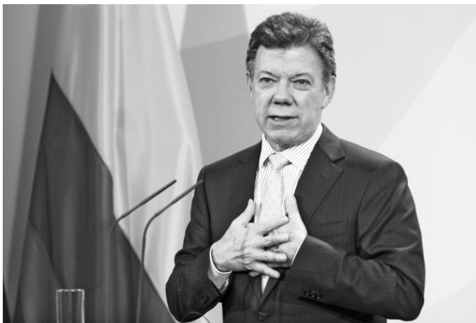
Президент Колумбии Хуан Мануэль Сантос