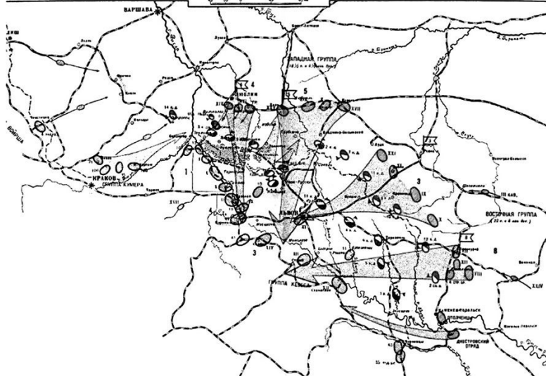
Рис. 1. Боевые действия в Галиции в августе 1914 г.

Источник: Самокиш Николай. Бой под Ярославом // Нива. 1914. 8 нояб. № 45.