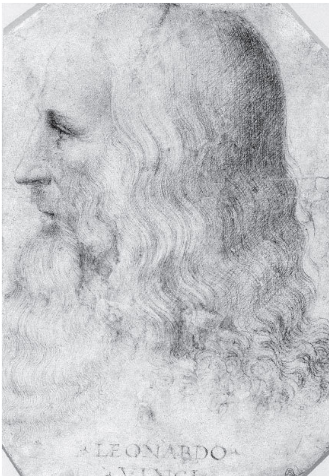
Портрет Леонардо да Винчи в профиль. Франческо Мельци. 1515–1518

Несомненно, что не только наружность, но и значительную долю умственных качеств Леонардо унаследовал не от отца, а от умершей в неизвестности матери-крестьянки, но своим