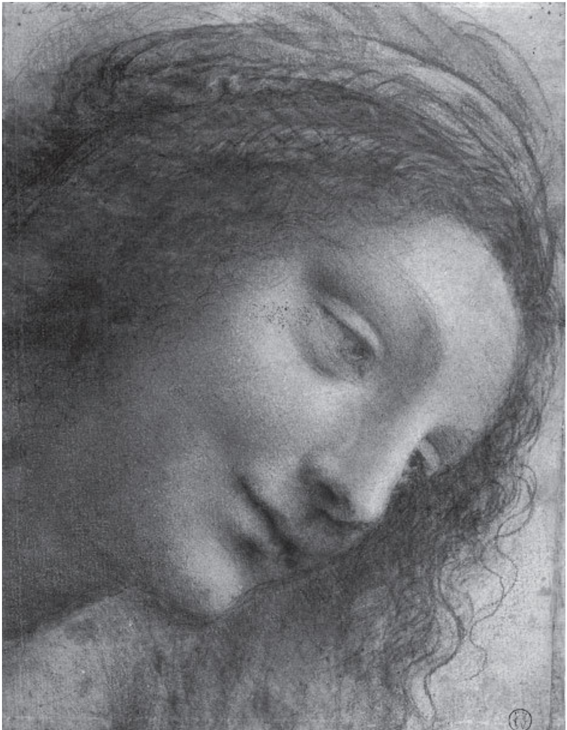
Леонардо да Винчи. Голова девы. 1508–1512

В том же году Леонардо основал в Милане знаменитую Академию, получившую его имя. До сих пор в Миланской Амвросианской библиотеке хранятся три выгравированных на меди рисунка, на которых видны слова: Academia Leonardi Vinci . Среди манускриптов Леонардо есть многие, составляющие, по-види мому, программы лекций, которые он читал в Академии. Рукописи эти, написанные в манере Леонардо справа налево, испещрены рисунками, относящимися к теории живописи, и чертежами по геометрии и механике. Увлекаясь предметом, Леонардо во всем хотел быть самостоятельным творцом. Планы его необычайно широки. Во