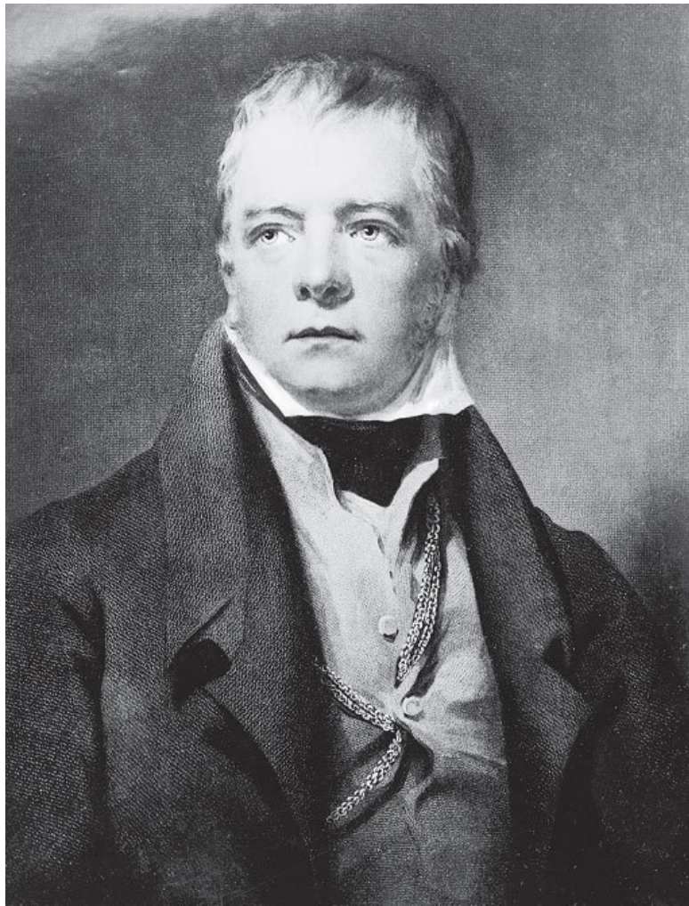
Портрет Вальтера Скотта.